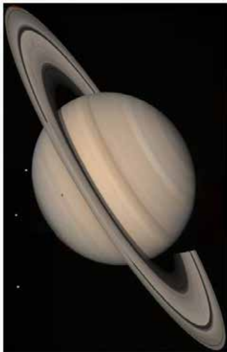
Saturn (planet) large.jpg

This true color picture was assembled from Voyager 2 Saturn images obtained Aug. 4 [1981] from a distance of 21 million kilometers (13 million miles) on the spacecraft's approach trajectory. Three of Saturn's icy moons are evident at left. They are, in order of distance from the planet: Tethys, 1,050 km. (652 mi.) in diameter; Dione, 1,120 km. (696 mi.); and Rhea, 1,530 km. (951 mi.). The shadow of Tethys appears on Saturn's southern hemisphere. A fourth satellite, Mimas, is less evident, appearing as a bright spot a quarter-inch in from the planet's limb about half an inch above Tethys; the shadow of Mimas appears on the planet about three-quarters of an inch directly above that of Tethys. The pastel and yellow hues on the planet reveal many contrasting bright and darker bands in both hemispheres of Saturn's weather system. The Voyager project is managed for NASA by the Jet Propulsion Laboratory, Pasadena, California, United States.