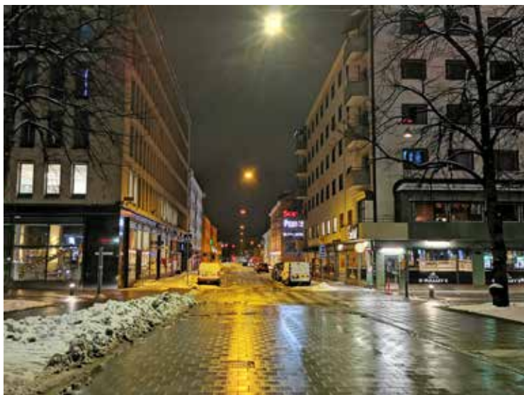
Natt i Vasa