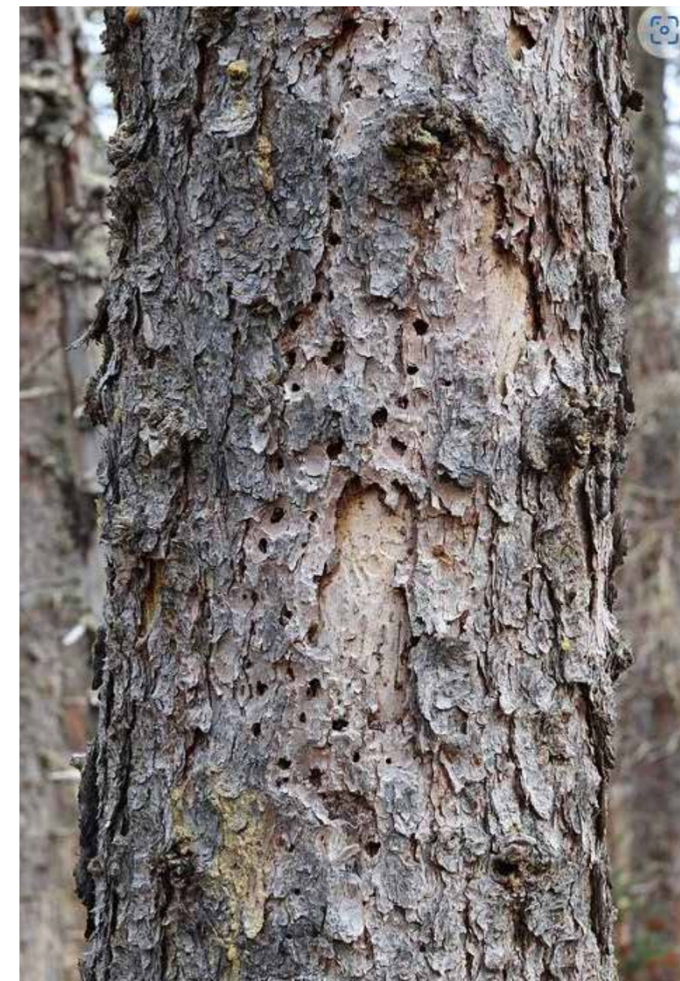
En gran angripen av granbarkborren

Granbarkborren kan bilda en symbiotisk relation med vissa Ophiostomata-les-svampar. Dessa