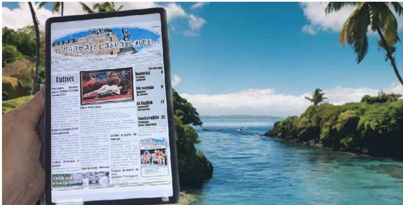
Som här på Fijo-öarna i Stilla Havet

DENNA TIDNING KAN MAN LÄSA VAR SOM HELST