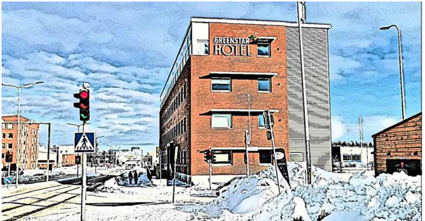
Förra veckans hus Opistotalo