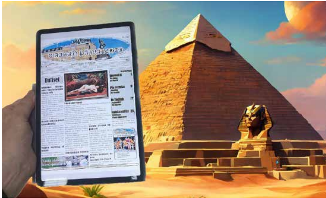
Kuten tässä, Egyptissä

on tällä hetkellä lausuntokierroksella, pyrkii turvaamaan laadukasta ja tehokasta hoitoa ilman suuria lisäkustannuksia.