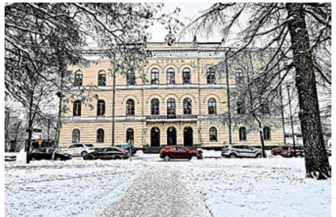
Viime viikon talo: Palosaaren kirjasto PhitoScetch