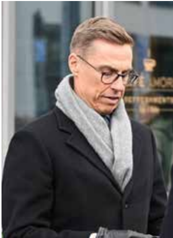
Alexander Stubb – Kansainvälinen Vaikuttaja ja Tiedon Puolesta puhuja