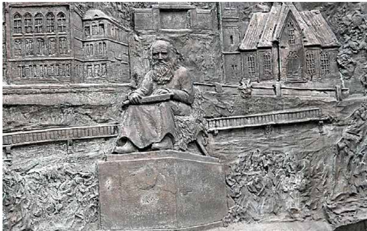
*10* Photo Supplement