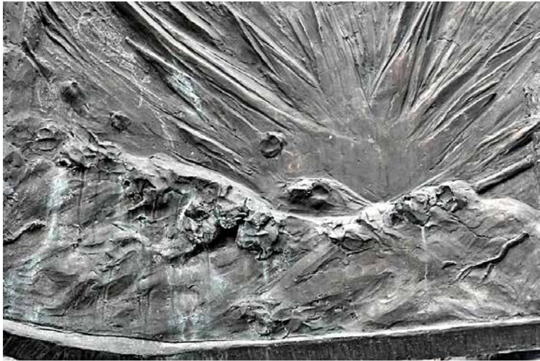
*8* Photo Supplement