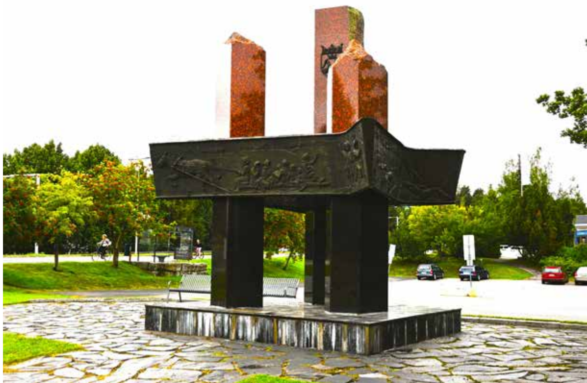
Evakkotien muistomerkki Kuopiossa Minnesmärket för Evakueringsvägen i Kuopio The Memorial for Evacuation Road in Kuopio Пам'ятник Евакуаційному шляху в Куопіо