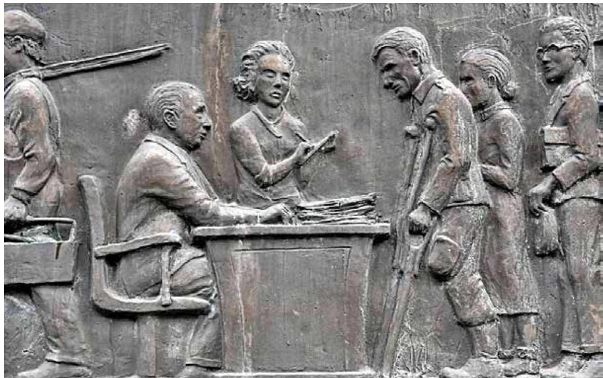
*12* Photo Supplement