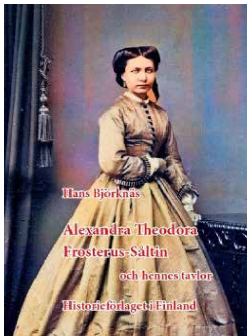
A book in Swedish about the famous woman artist i Vaasa, Alexandra Frosterus-Sältin, You can buy it here:

Лише в грудні буде готовий остаточний список кандидатів. Якщо ви не партійний кандидат, вам потрібно зібрати 20 000 карток підтримки. Якщо кандидатів багато, то може статися, що це трохи вплине на те, хто з двох пройде до другого туру. Попереду захоплюючи вибори!