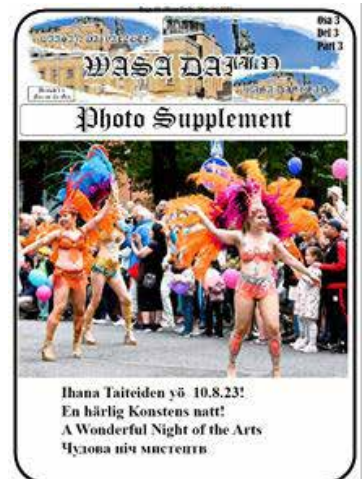
Ihana Taitteen yö 10.8.23! En härlig Konstens natt! A Wonderful Night of the Arts Чудова ніч мистецтва

Personer med celiaki fick ett kostbidrag på 23,60 euro per månad fram till slutet av 2015. Stödet stoppades som ett led i regeri-