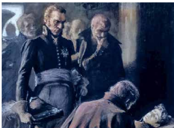
Next week: Oravais 1808

— There is one thing that I particularly want to talk to you about, dear listeners, and that is the inappropriate way in which you all hurry out of the church, so that there is formal crowding and noise at the door. Now, as a personal favor, I ask you to remain quietly in your seats until everyone has left.