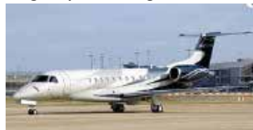
Embraer Legacy 600.

Rosaviatsia, den ryska luftfartsmyndigheten, bekräftade att Prigozhin och en annan högt uppsatt Wagner-figur, Dmitry Utkin, var bland passagerarna som reste med det ödesdigra affärsjet Embraer. Kraschen inträffade på onsdagskvällen, och även om den exakta orsaken ännu inte har fastställts, spekuleras det i överflöd på grund av Prigozhins tumultartade förhållande till den ryska militären och hans inblandning i myteriet tidigare i år.