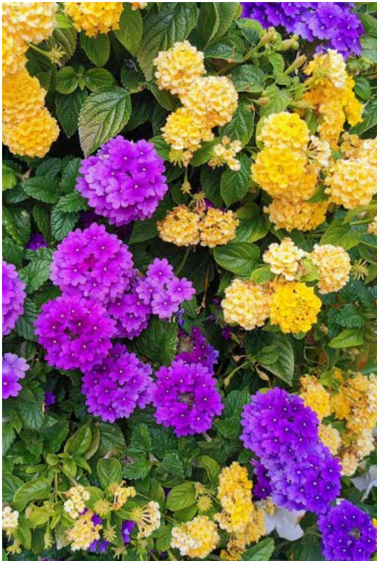
Flowers in Vasa. The city's horticulture department certainly does a wonderful job this spring. To make our city beautiful and pleasant!

comprehensive written information detailing the eligibility criteria set forth by the welfare region.