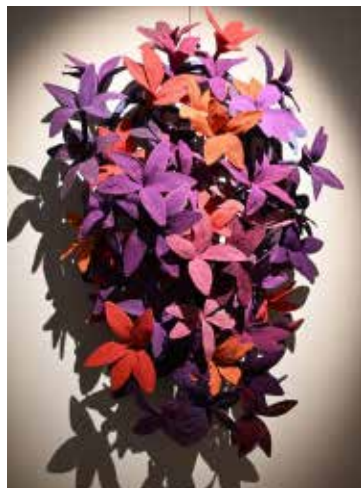
En välkänd textilkonstnär från

Textilkonst, från koppartråd till textilreliefer