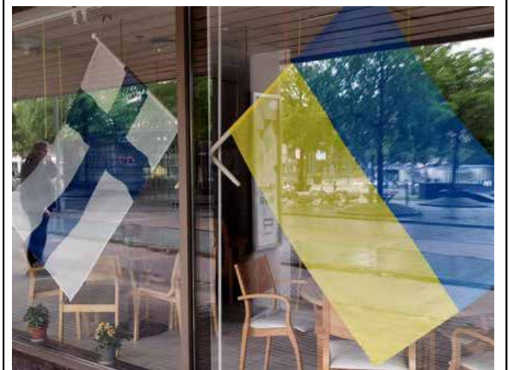
Kalyna-cafet vid Övre torget. Vi stöder Ukraina!