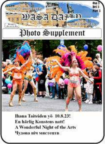
Photo Supplement on page 25

The core objective of this initiative is to prevent financial marginalization and excessive indebtedness among recipients while fostering self-reliance. The administration of social credit adheres to the regulations stipulated in the social lending law (1133/2002). Prior to approval, credit beneficiaries are provided