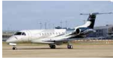
Embraer Legacy 600.

due to Prigozhin's tumultuous relationship with the Russian military and his involvement in the mutiny earlier this year.