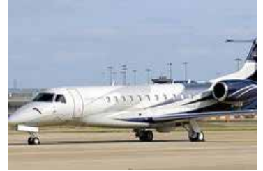
Embraer Legacy 600.

ja Gray Zone, Wagneriin liittyvä näkyvä Telegram-kanava, julkisti Prigozhinin kuoleman. He ylistivät häntä sankarina ja isänmaana, joka kohtasi hänen kuolemansa ”Venäjän petteureiksi kutsuttujen” käsissä.