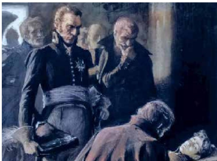
Nästa vecka: Oravais 1808