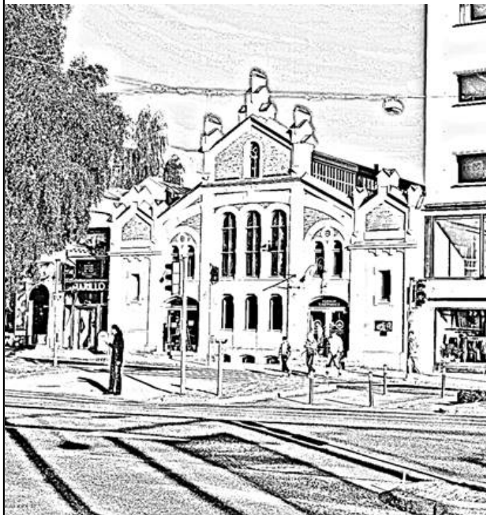
Förra veckans hus: Österbottens museum