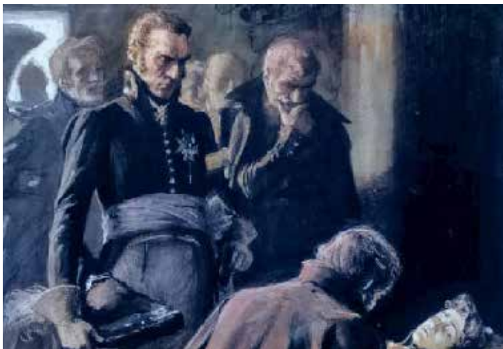
Ensi viikolla: Oravainen 1808

Waasan Päivälehti vaasanpaivalehti@gmail.com