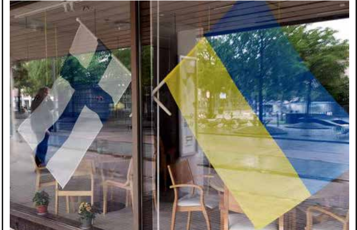
Kalyna cafe at the Town Squar. Glory to Ukraine!