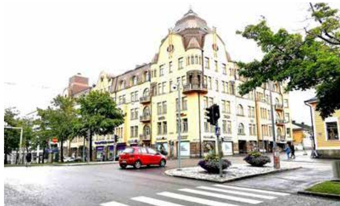
Last weeks house: Kurtenia