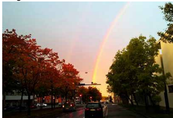
Rainbow over Vaasanpuistikko