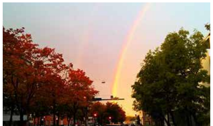
Sateenkaari Vaasanpuistikon yllä