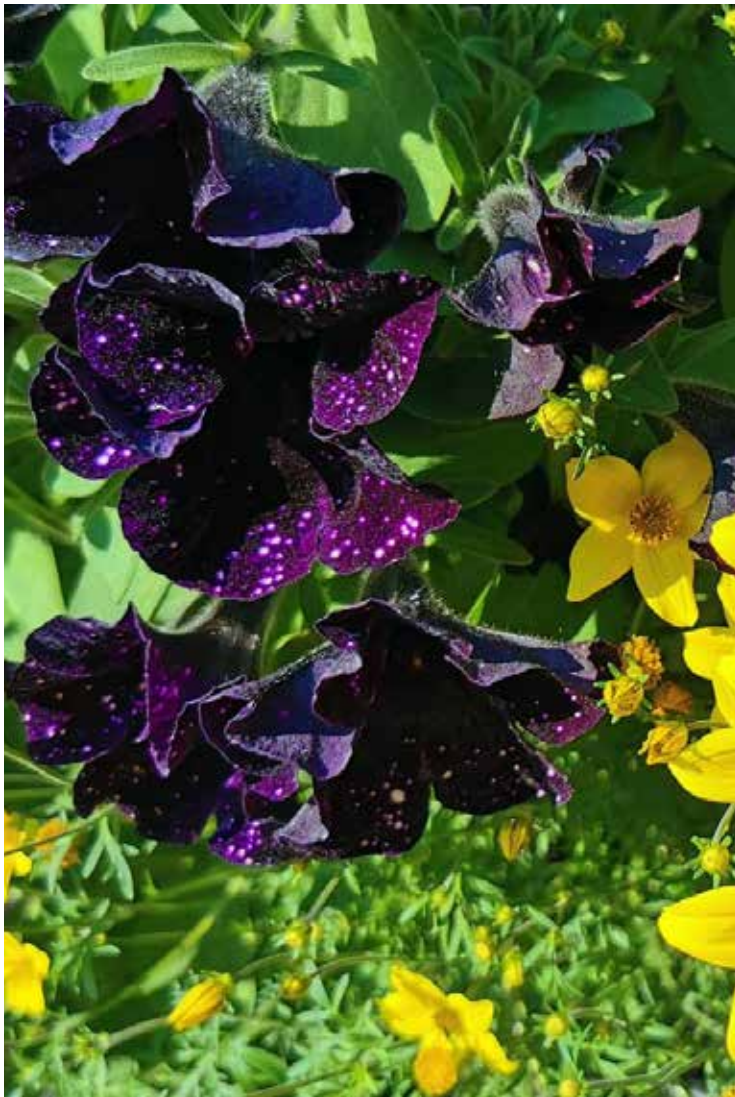
Flowers in Vasa. The city's horticulture department certainly does a wonderful job this spring. To make our city beautiful and pleasant!

played a major role in the development of Finnish landscape painting. His works continue to be admired by art lovers worldwide.