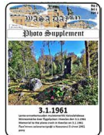
Kuvaliite sivu 27

semamaalauksen kehityksessä. Hänen teoksiaan ihailevat edelleen taiteen ystävät maailmanlaajuisesti.