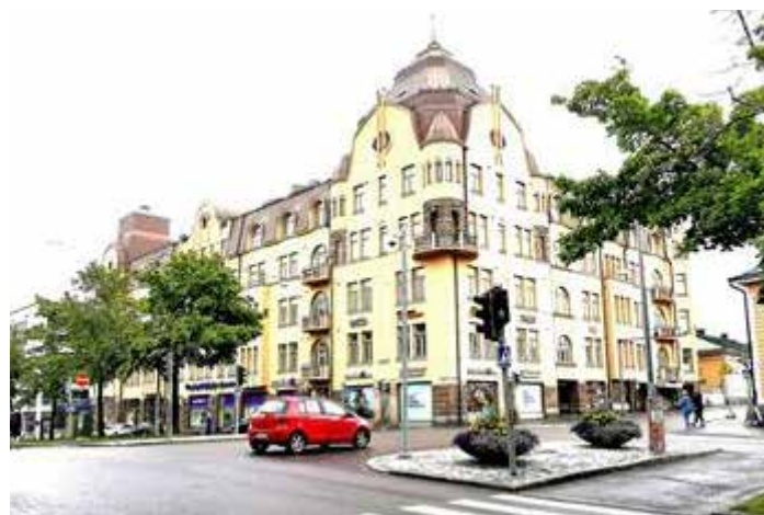
Viime viikon talo: Kurtenia