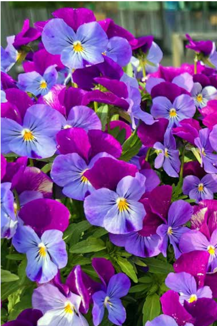
Kukat Vaasassa. Kaupungin puutarhaosasto tekee varmasti upeaa työtä tänä keväänä. Tehdään kaupungistamme kaunis ja viihtyisä!