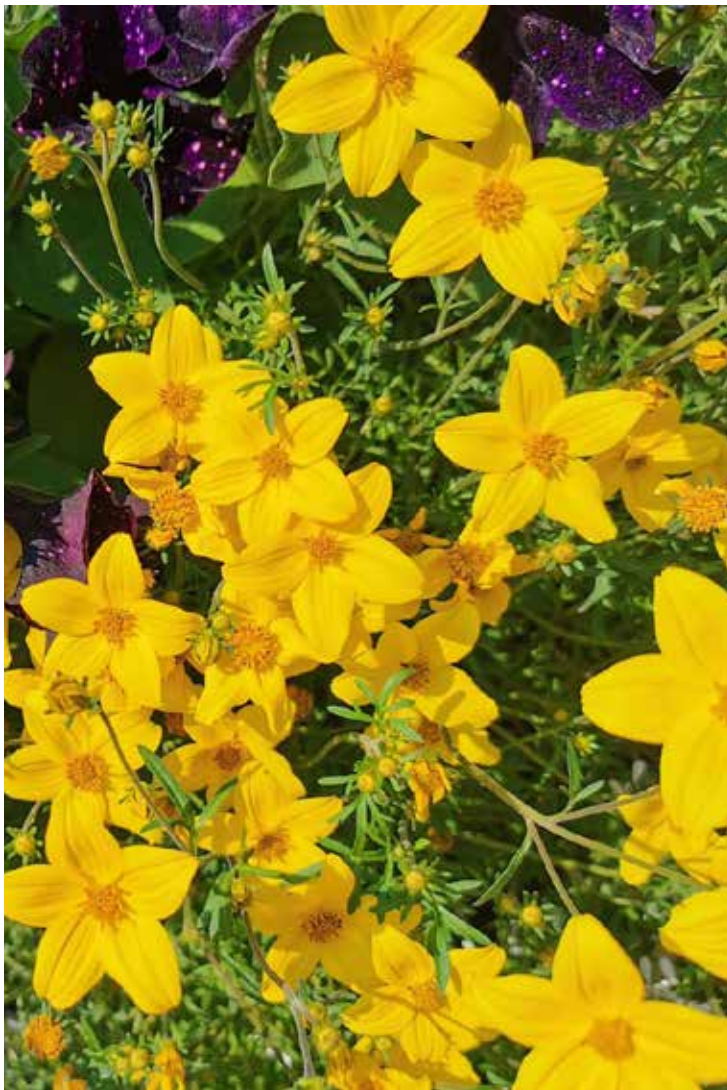
Blommor i Vasa. Visst gör stadens trädgårdsavdelning ett underbart arbete så här på våren. För att göra vår stad vacker och trivsamt!