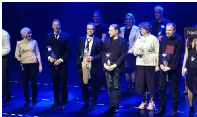
”Nokia”näytelmällä oli ensi-ilta kaupunginteatterissa