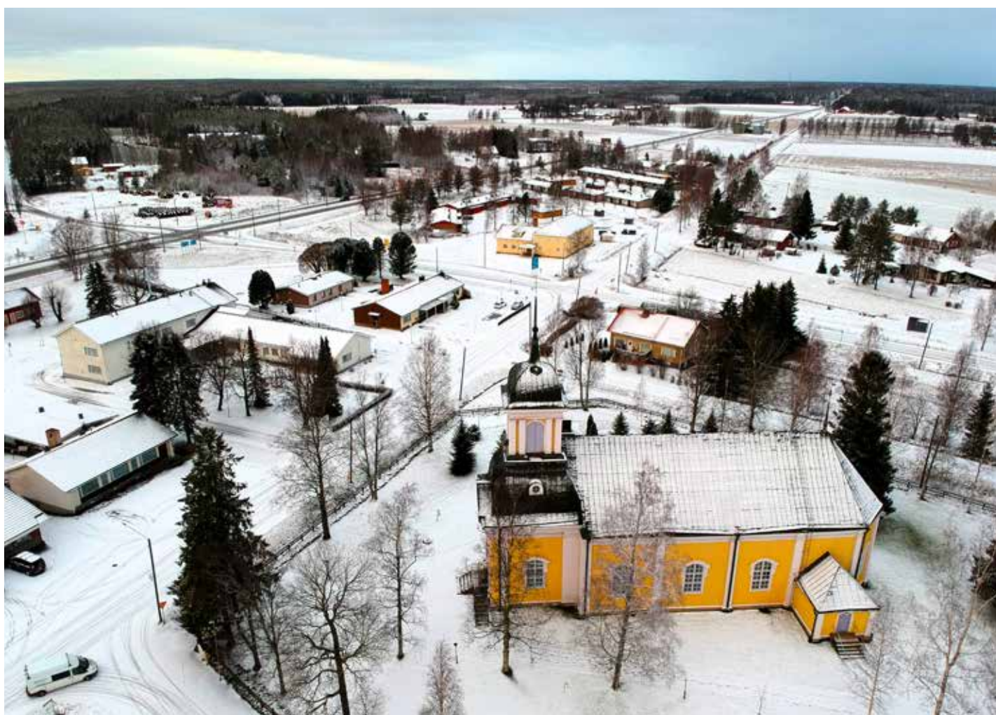
Pörtom kyrkoby sedd från ovan Pirttikylän kirkonkylä ylhäältä katsottuna The church village of Pörtom seen from above Вид згори на церковне село Портом