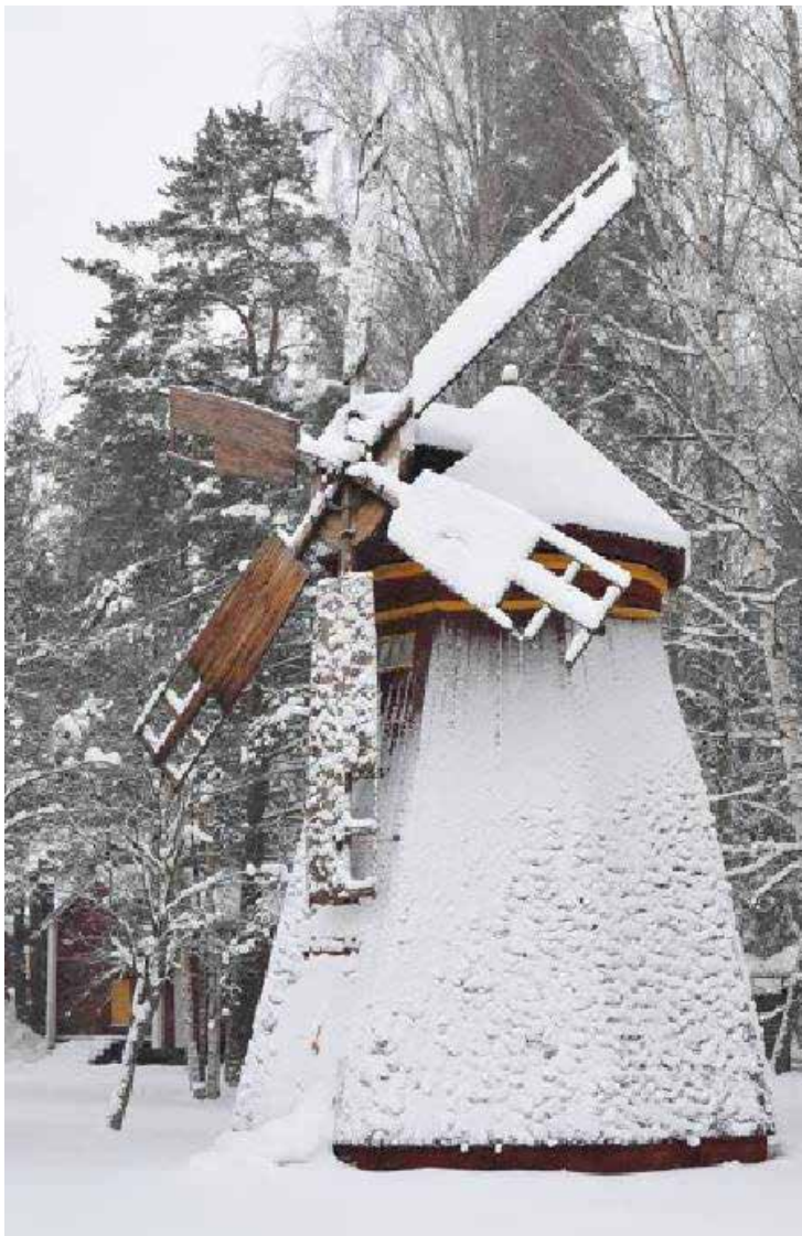
Vinter i Seinäjoki