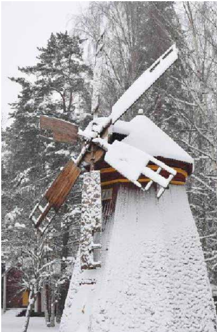
Winter in Seinäjoki