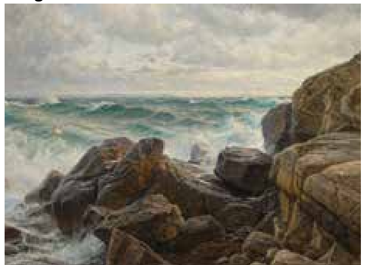
The Berndt Lindholm exhibition at Tikanoja is worth a visit