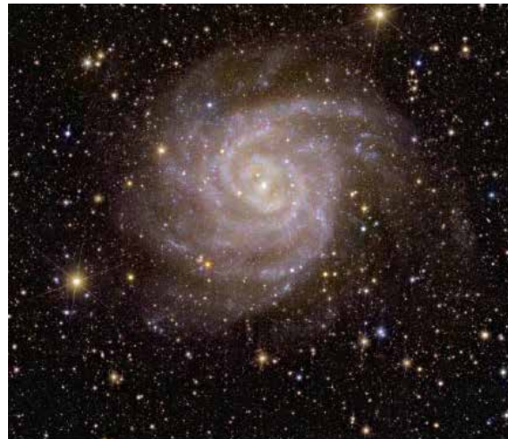
The spiral galaxy IC 342, located about 11 million light-years from Earth, lies behind the crowded plane of the Milky Way: Dust, gas, and stars obscure it from our view. Euclid used its near-infrared instrument to peer through the dust and study it.

den 25 november 2023 - 09:31 Kära ukrainare! Kära människor! Varje år i slutet av november går en kall rysning längs ryggraden. Oavsett väderförhållanden och var vi befinner oss. Med kyla i våra hjärtan förenas vi alla av ett tragiskt datum - den fjärde lördagen i november. Minnesdagen för holodomor. När vi känner stor smärta och ilska på samma gång, eftersom det är omöjligt att glömma, förstå och framför allt förlåta de fruktansvärda folkmordsbrott som det ukrainska folket upplevde under 1900-talet. Män, kvinnor, barn. Miljontals oskyldiga och mördade. Oräkneligt och oräkneligt. Oräknat vid den tidpunkten. När allt annat än sanningen skrevs i kolumnen "dödsorsak". De "avskrev" kall-sinnigt tusentals människor, ansåg det inte nödvändigt att räkna, betraktade inte människor som sådana. Oräkneliga totalt. Hur många av dem, ihjälsvultna, föll helt enkelt på åkern, på vägen, på sin egen gård? Hur många hittades inte? Hur många söktes inte efter? När de styrande hade ett behov: att alla skulle hålla tyst, och de anhöriga varken hade förmågan eller orken att söka och bevisa sanningen, och då fanns det ingen kvar att söka. Hur många finns det? Ingen vet det exakta svaret på denna fråga. Precis som svaren på andra frågor. Hur kan man vil-