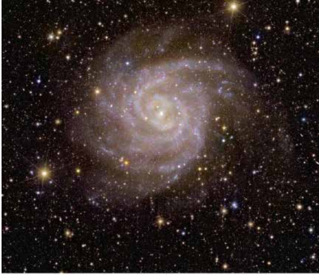
The spiral galaxy IC 342, located about 11 million light-years from Earth, lies behind the crowded plane of the Milky Way: Dust, gas, and stars obscure it from our view. Euclid used its near-infrared instrument to peer through the dust and study it.