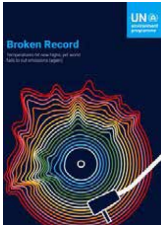
The Emissions Gap Report

yet world fails to cut emissions Nations. (again), finds that global low-carbon transformations are needed to deliver cuts to predicted 2030 greenhouse gas emissions of 28 per cent for a 2°C pathway and 42 per cent for a 1.5°C pathway.