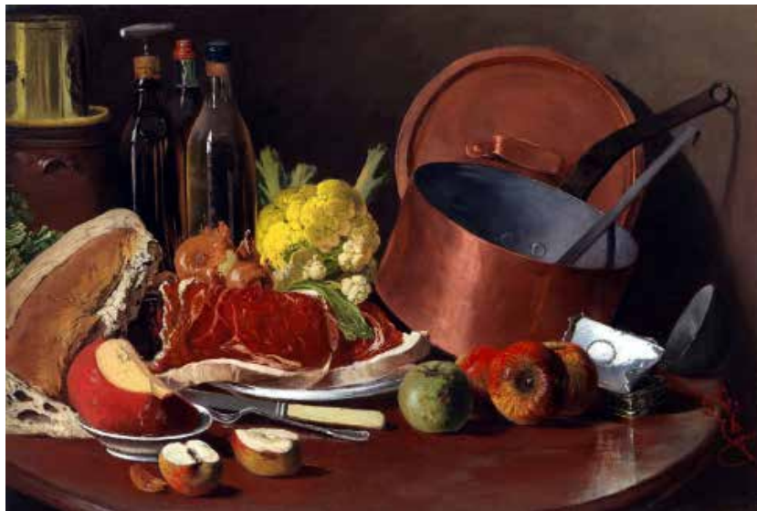
Fanny Maria Churberg, Finnish artist (1845—1892).