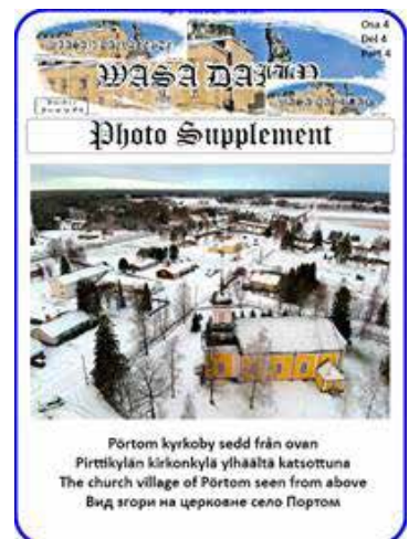
Fotobilaga på sid 25

I ett häpnadsväckande avslöjande har Copernicus Climate Change Service (C3S) rapporterat att oktober 2023 officiellt har blivit den varmaste månaden som någonsin registrerats. Den globala medeltemperaturen under denna period överträffade alla tidigare rekord, vilket understryker vikten av att ta itu med klimatförändringarna.