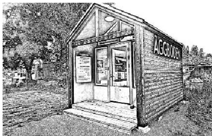
Viime viikon talo: Loftet