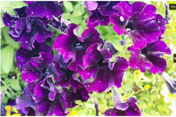
Blommor i Vasa. Visst gör stadens trädgårdsavdelning ett underbart arbete så här på våren. För att göra vår stad vacker och trivsamt!

let. Strävan är att minska koldioxidutsläppen från trafiken bland annat genom att öka cykling och gång. (vaasa.fi)