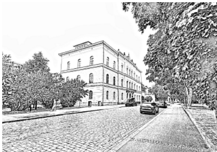
Förra veckans hus: Före detta svenska samskolan, numera Arbis