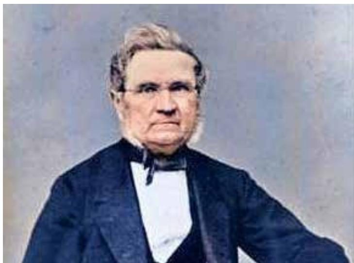
Nästa vecka: Vem var Carl Gustaf Wolff?

Annonspriset är 6 €/spaltmillimeter. Standardannonser är billigare (25 mm hög=140 €, 50 mm = 280 €, 75 mm=400 €. Upprepade annonser = 30% rabatt. Sänd annonser till wasadagblad@gmail.com som jpg, tiff eller png, annonserna förminskas sedan till spaltbredd 46 mm.