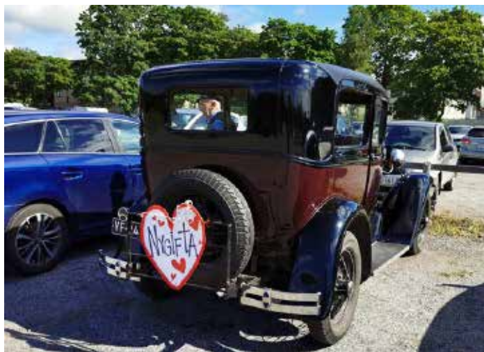
Bröllopsbil modell 1930