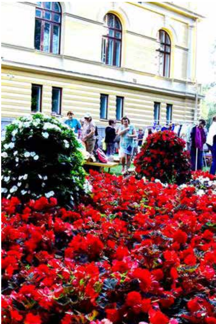
Blommor i Vasa. Visst gör stadens trädgårdsavdelning ett underbart arbete så här på våren. För att göra vår stad vacker och trivsamt!