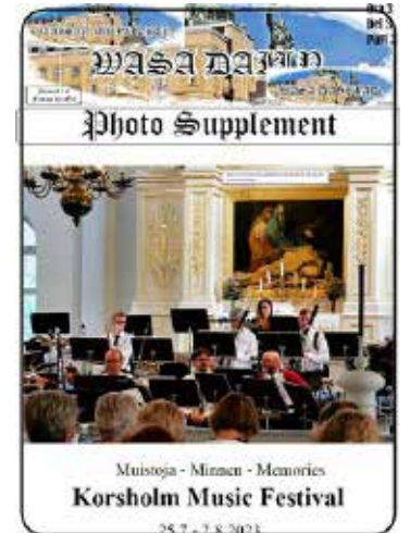
Fotobilaga på sid 11

– Att utöka stödet till unga med celiaki mellan 16 och 18 år är