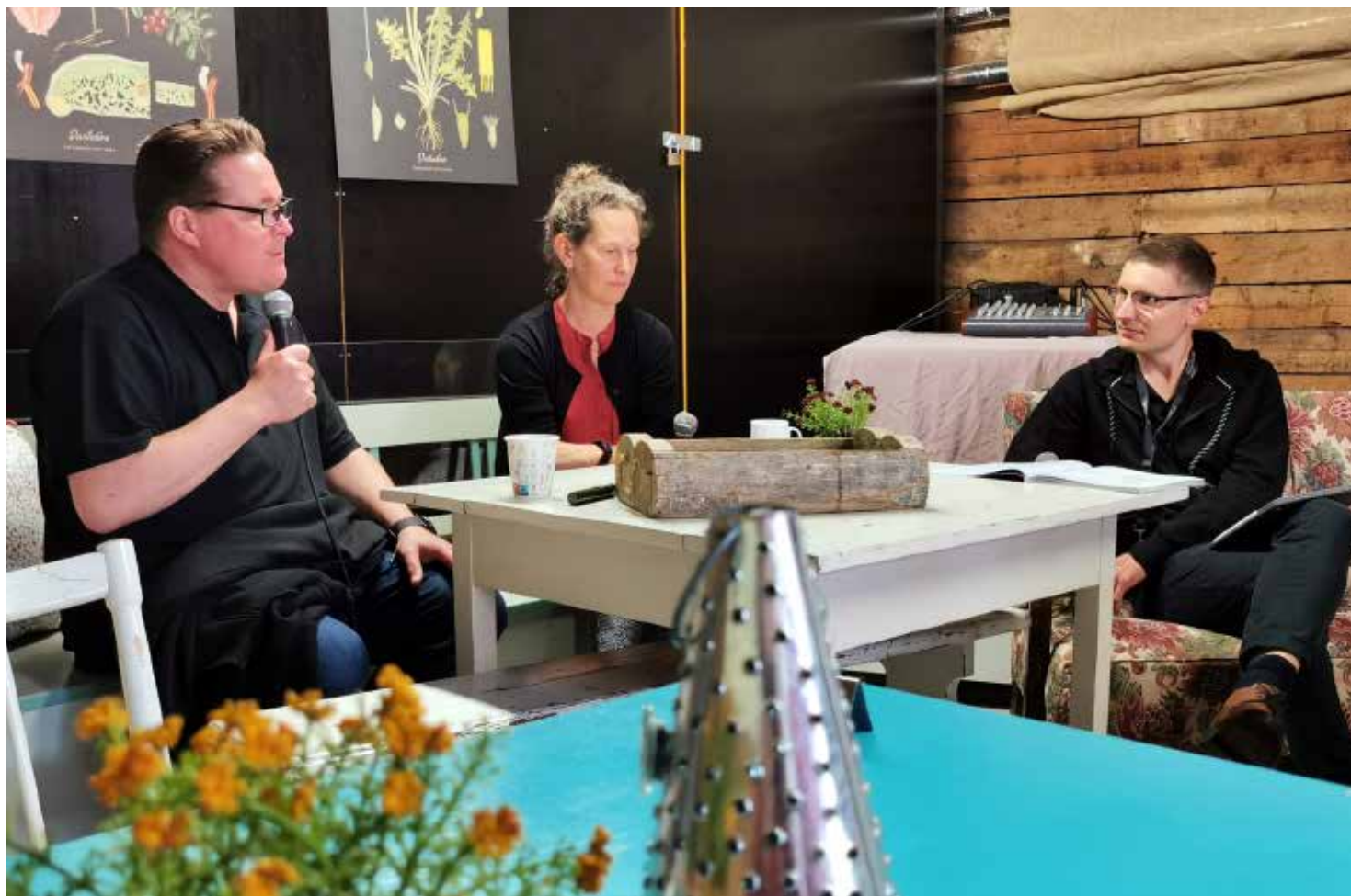
Keskusteluja Loftetin "ladossa" Samtal i Loftets "lada"