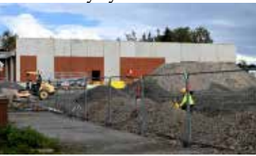
KPO, företaget som bygger

S-marknaden ska byggas för att vara energieffektiv, med bergvärme, solpaneler på taket och moderna kylsystem.