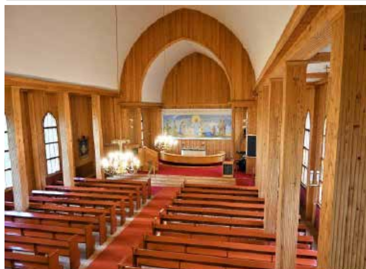
Nästa vecka: Tiistenjoki bykyrka i Lappo

Gå till Facebook och skriv in operaupplevelser i sökrutan.