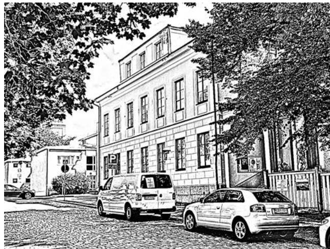
Förra veckans hus: Stadshuset