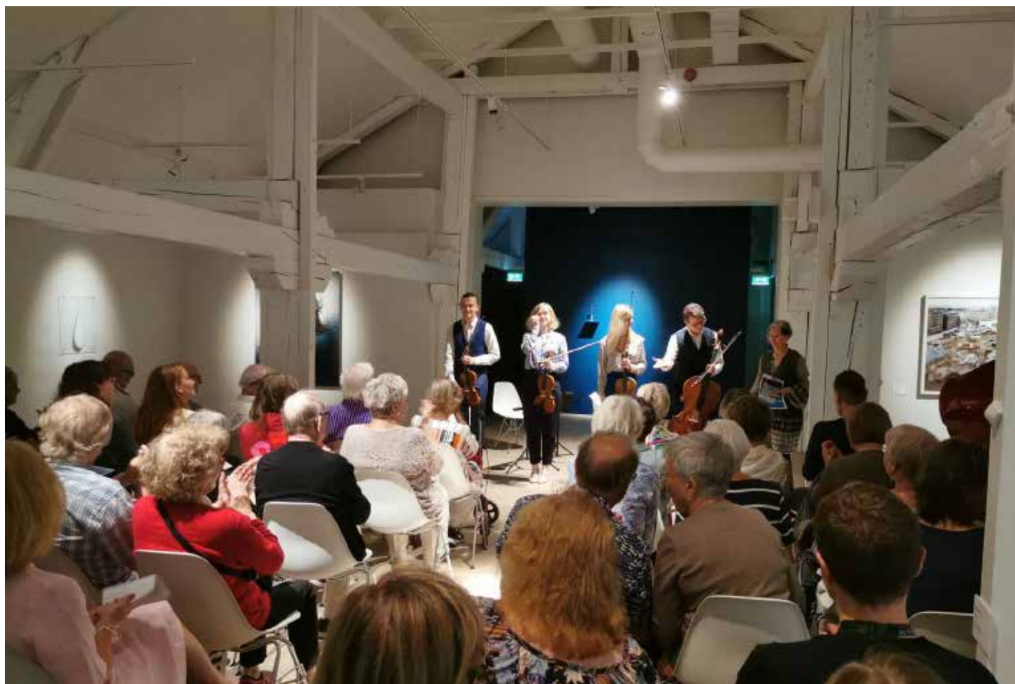
Intima brev - Intiimit kirjeet - Intimate letters på Kuntsi den 30.7.223