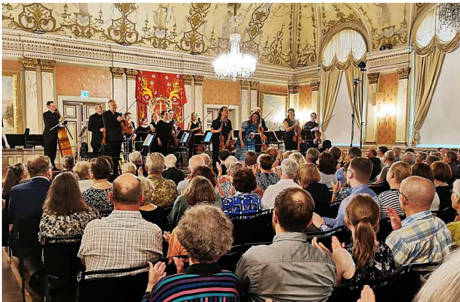
Avslutningskonser, päätöskonserttik, closing concert Keski-Pohjanmaan kamariorkesteri