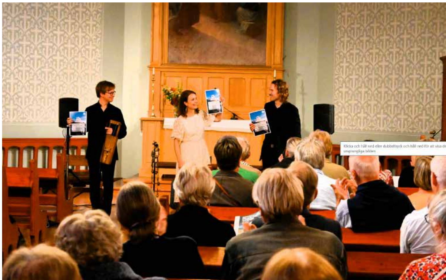
Ensemble Gamuti i Brändö kyrka den 29.7.23