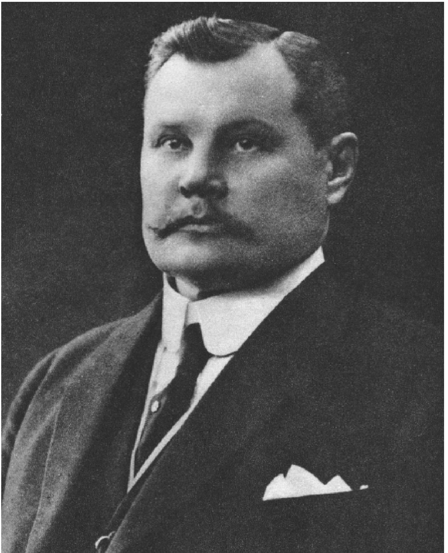
Alfred Kordelin on haudattu Raumalla, Kordelinin kappelin alle Alfred Kordelin ligger begravd i Rauma, under Kordelins kapell Alfred Kordelin is buried in Rauma, under the Kordelin chapel Альфред Корделін похований у Раумі, під каплицею Корделіна