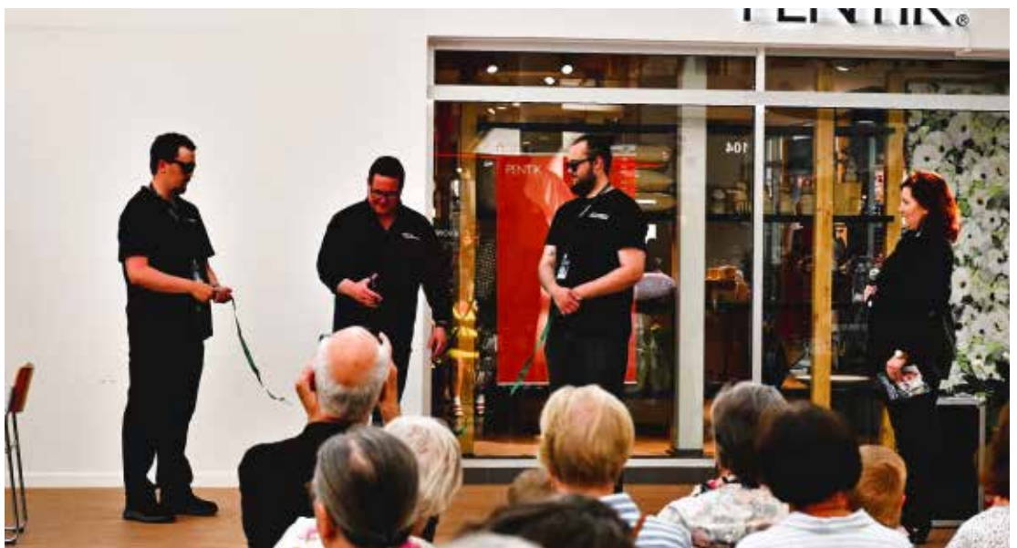
Avajaiset Rewell Centerissä 26.7.23 Öppning i Rewell Center 26.-7.23

The first festival was organized in 1983, 40 years ago. And since these these festivals have been arranged every year. Also during the corona era, the festival organized, and streamed to spectators. The festival now has a solid reputation and is internationally known. This year's festival was a success. Here are a number of pictures from this year's festival.