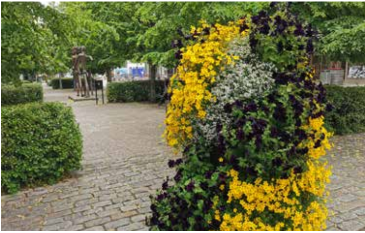
Kukat Vaasassa. Kaupungin puutarhaosasto tekee varmasti upeaa työtä tänä keväänä. Tehdään kaupungistamme kaunis ja viihtyisä!