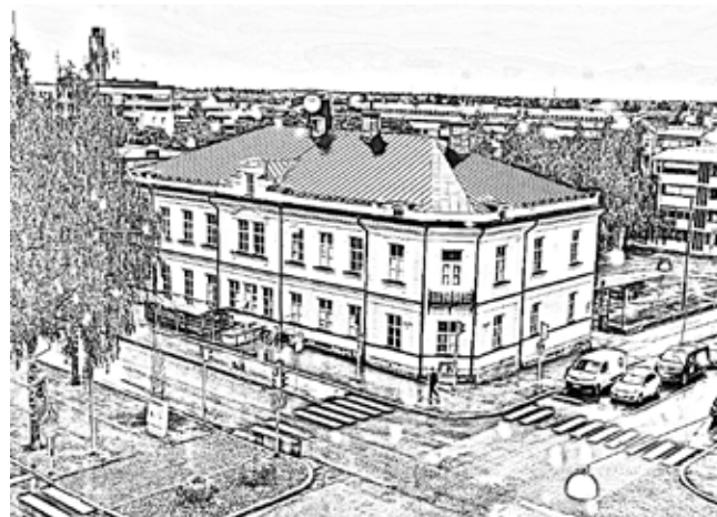
Viime viikon talo: Entisen Kirkkoapteekin talo