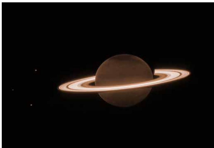
Ensi viikolla: James Webb, avaruusteleskooppi