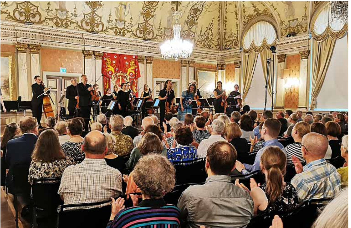
Avslutningskonser, päätöskonserttik, closing concert Keski-Pohjanmaan kamariorkesteri