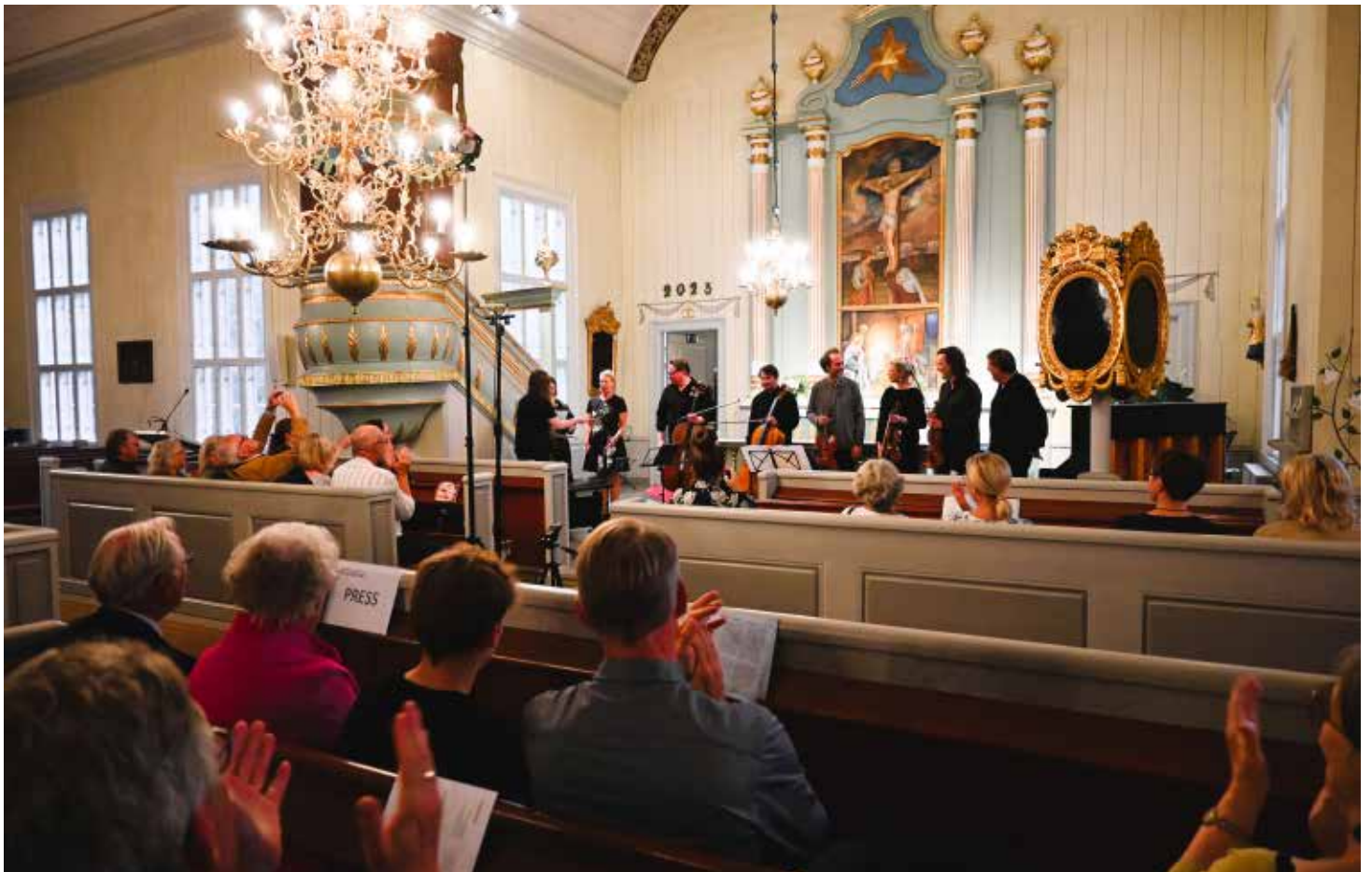
“Miniö” i Maxmo kyrka 27.7.23