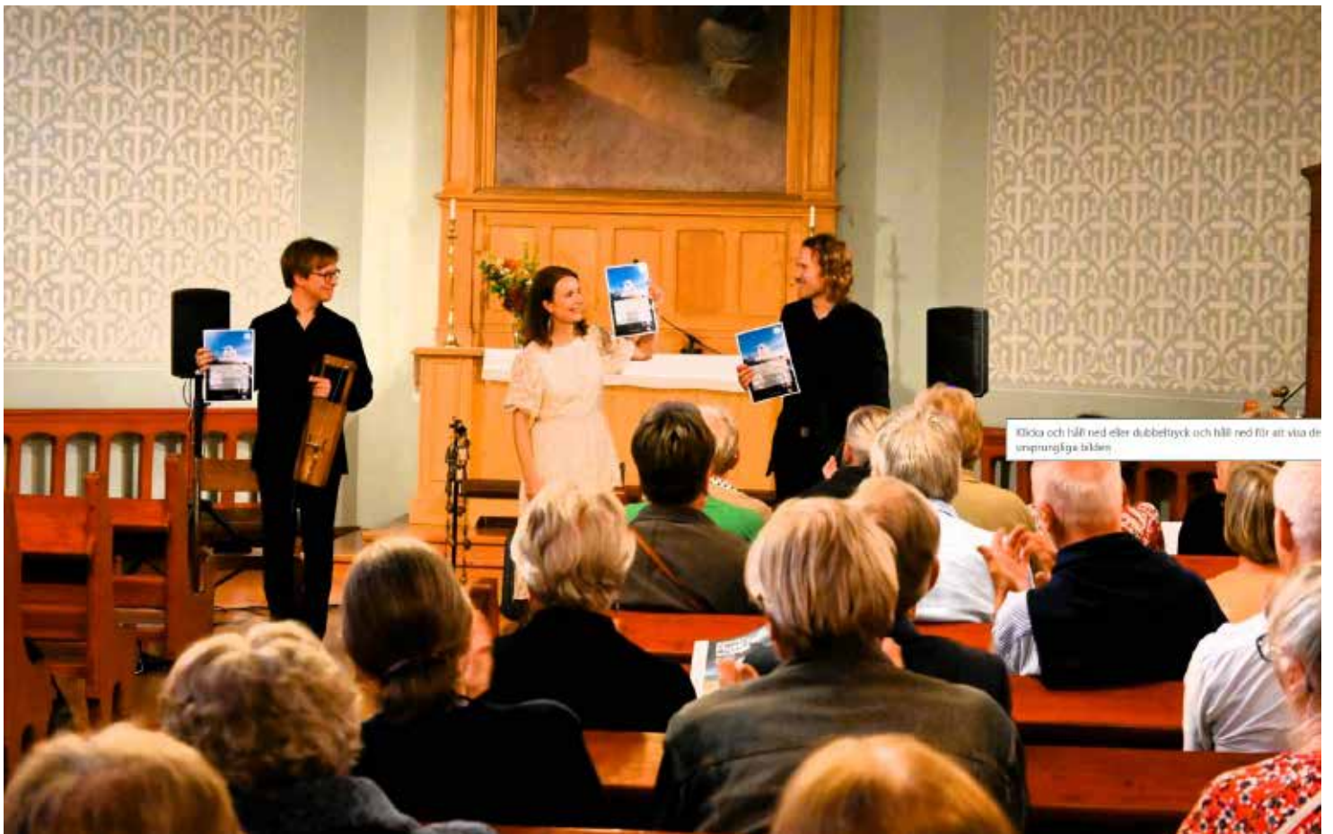
Ensemble Gamuti i Brändö kyrka den 29.7.23