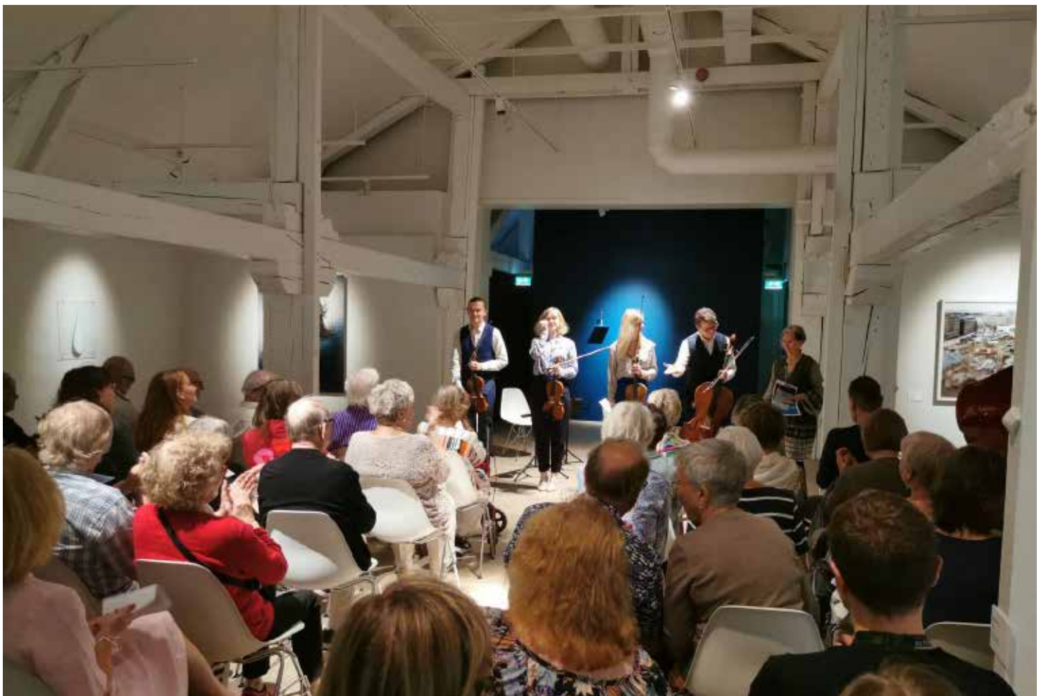
Intima brev - Intiimit kirjeet - Intimate letters på Kuntsi den 30.7.223