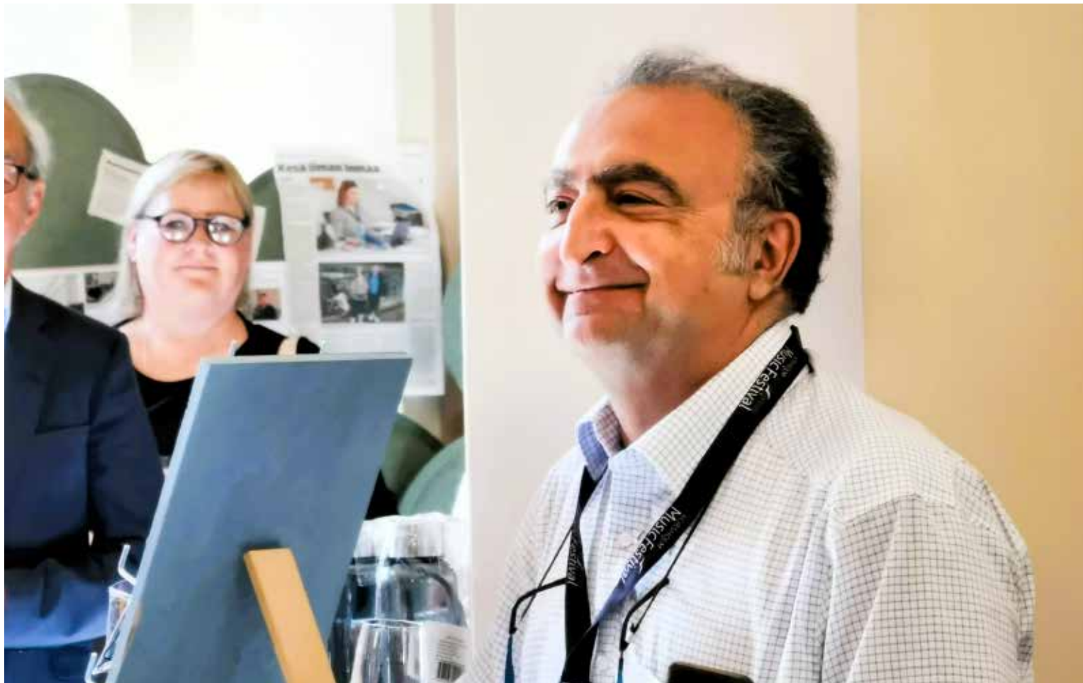
Composer Vladimir Agopov