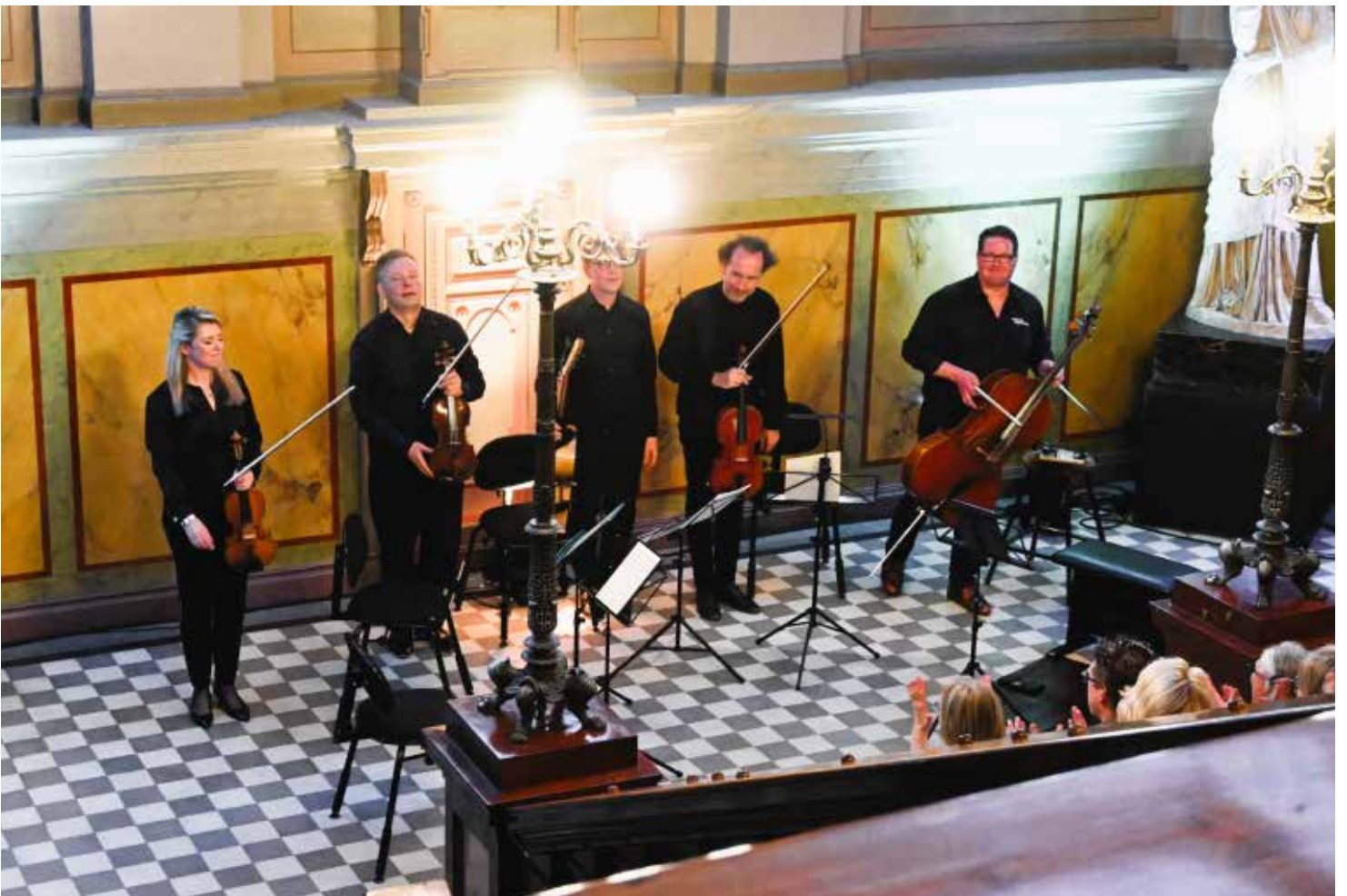
At Twilight of the Stairs, Vaasa City Hall, 30.7.23