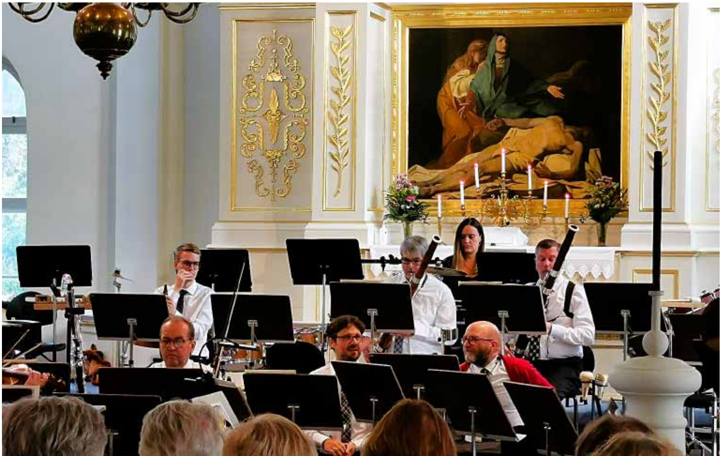
Avajaiskonsetti Mustasaaren kirkossa 26.7.23 Öppningskonsert i Korsholms kyrka Opening Concert in the Korsholm Church