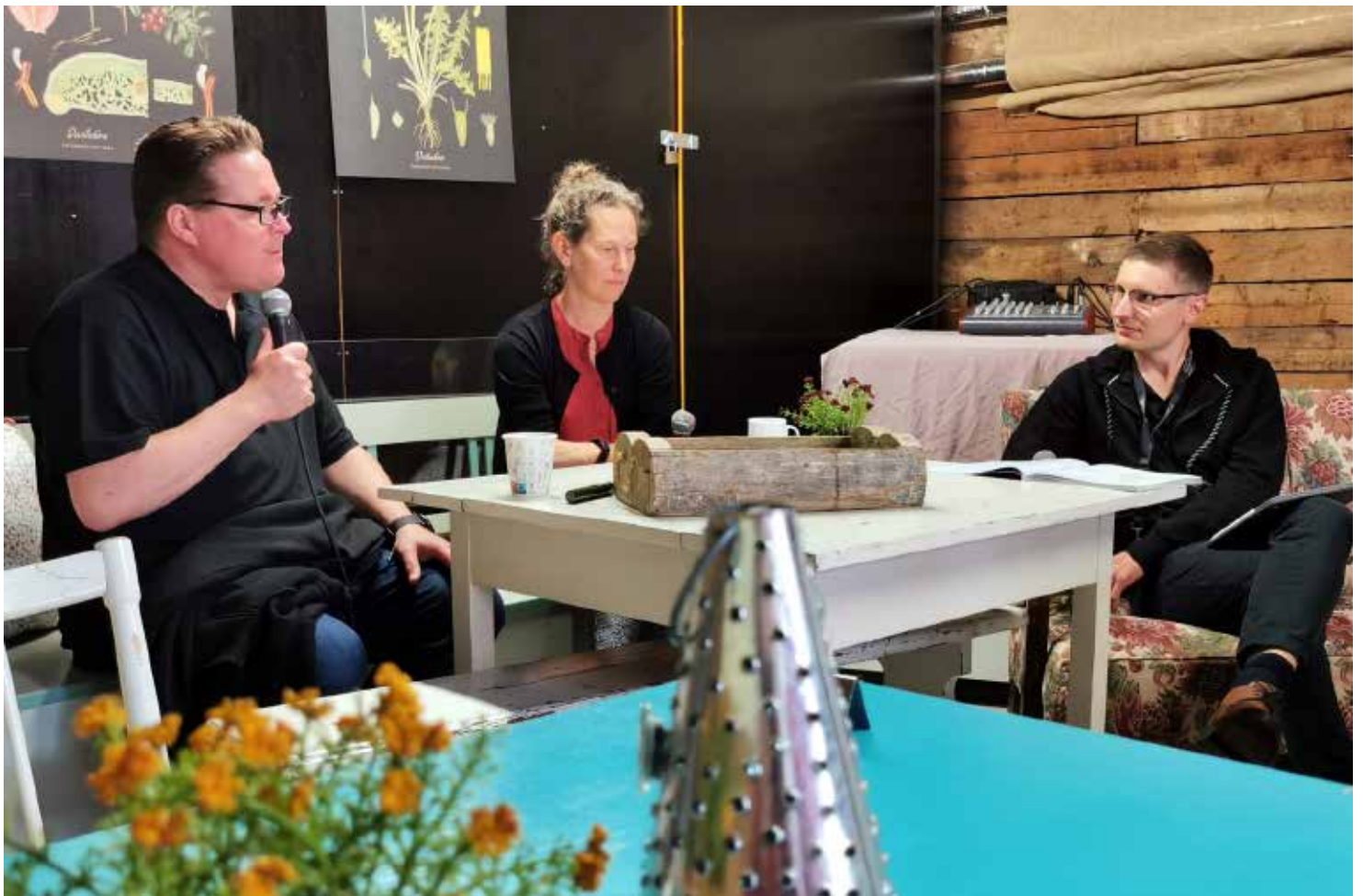
Keskustelija Loftetin "ladossa" Samtal i Loftets "lada"