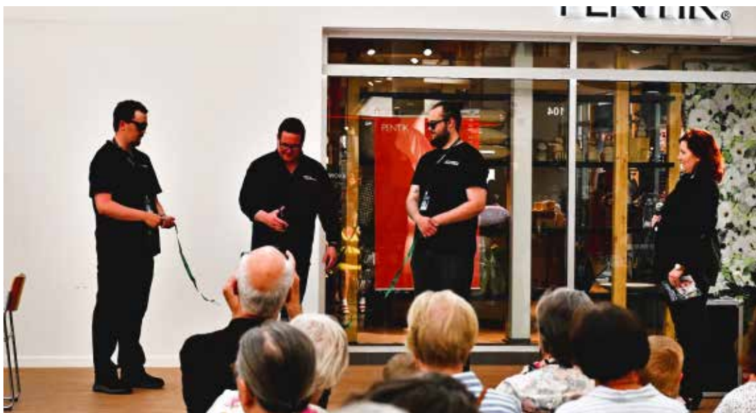
Avajaiset Rewell Centerissä 26.7.23 Öppning i Rewell Center 26.-7.23

Four decades ago, a group of music enthusiasts gathered at Stundars in Solf and decided to start a music festival. The first festival was organized in 1983, 40 years ago. And since these these festivals have been arranged every year. Also during the corona era, the festival organized, and streamed to spectators. The festival now has a solid reputation and is internationally known. This year's festival was a success. Here are a number of pictures from this year's festival.