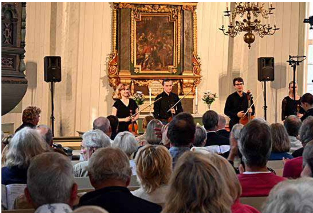
Korsholms kommuns 675 års jubileumskonsert i replot kyrka den 29.7.23

Перший фестиваль був організований у 1983 році, тобто 40 років тому. І з тих пір ці фестивалі влаштовуються щороку. Також у епоху корони фестиваль організовувався та транслювався глядачам. Зараз фестиваль має солідну репутацію та відомий у всьому світі. Цьогорічний фестиваль вдавсь. Ось декілька фото з цьогорічного фестивалю.