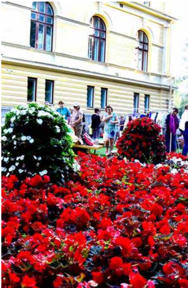
Kukat Vaasassa. Kaupungin puutarhaosasto tekee varmasti upeaa työtä tänä keväänä. Tehdään kaupungistamme kaunis ja viihtyisä!

KOVINA AIKONA Kertomus Suomen viimeisten nälkävuosien ajoilta KARL A. TAVASTSTJERNA Suomentanut Juhani Aho Julkaistu 1892. OSA 31