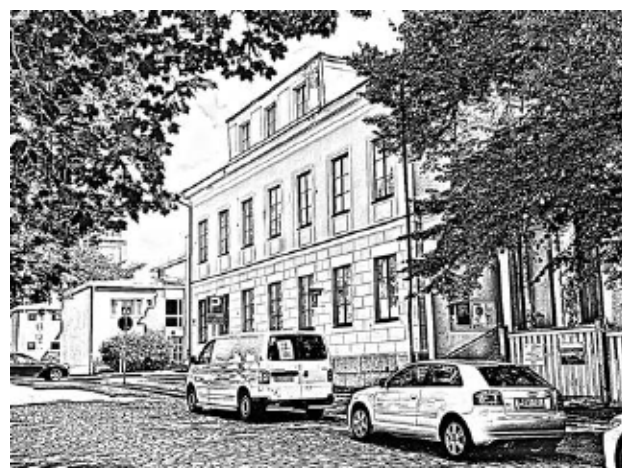
Viime viikon talo: Kaupungintalo