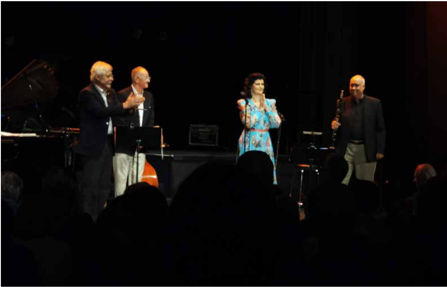
Tähtisumua - Stjärnstoft - Stardust-. Ritz 28.7.23