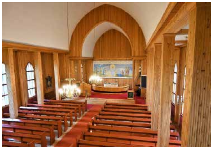
Ensi viikolla: Tiistenjoen kyläkirkko, Lapua

Perinnöllistä. — Uskotteko perinnöllisyyteen. — Kyllä! Näkisittepä vain, miten kaunis, vilkas ja lahjakas poika minulla on!