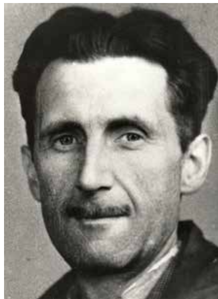
George Orwell (1903 - 1950).

"1984" är inte bara en varning för totalitarism, utan också en påminnelse om vikten av att värna om yttrandefrihet, integritet och kritiskt tänkande. I en tid då dessa värden utmanas, är Orwells roman mer aktuell än någonsin.