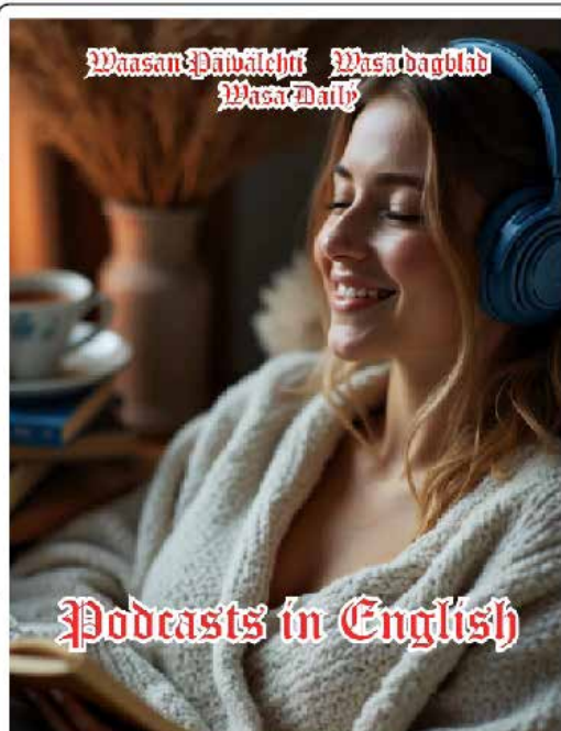
Podcast in English: Russian disinformation https://vpress.ovh/podcasts.htm

I den snabbt föränderliga världen av digitala medier fortsätter artificiell intelligens (AI) att tänja på gränserna och omforma branscher samt omdefiniera kreativa processer. En av de mest banbrytande utvecklingarna är Googles NotebookLM, en avancerad språkteknologi med potential att revolutionera poddsvärlden.