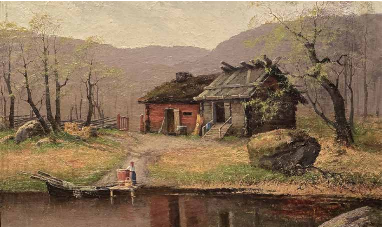
Ovan Ellen Favorins "Landskap" Nedan Elisabeth Jerichau-Baumanns "Sjöjungfru"