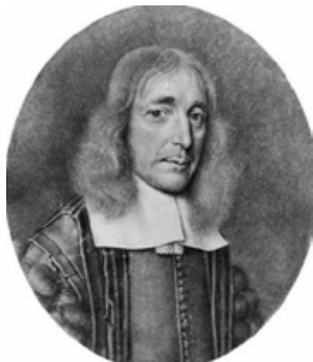
Thomas Willis (1621-75)

A kalasi är en sällsynt sjukdom i övre magmunnen på grnsen mellan matstrupen och magsäcken som gör det smärtsamt och svårt att äta. Det är som en grind som inte går att öppna: ringmuskeln i den nedre delen av matstrupen slappnar inte av ordentligt, vilket gör att maten inte når magsäcken. Detta kan leda till ett brett spektrum av symtom och ha en betydande inverkan på livskvaliteten. Det finns olika behandlingar, och även om behandlingen inte kan bota sjukdomen kan symtomen lindras väldigt bra..