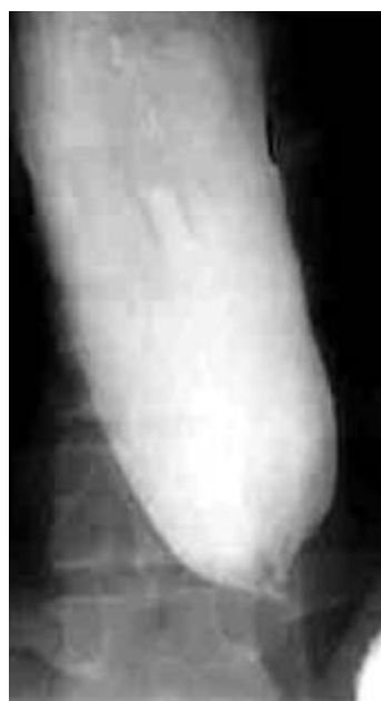
Utvidgad matstrupe i en röntgenbild

Att diagnostisera akalasi kan vara utmanande, eftersom sym-