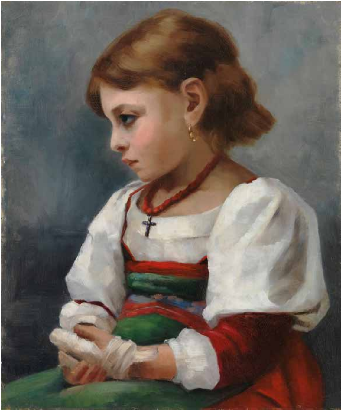
Maria Martinau: Flickan (odaterad). Finlands Nationalgalleri / Konstmuseet Ateneum.