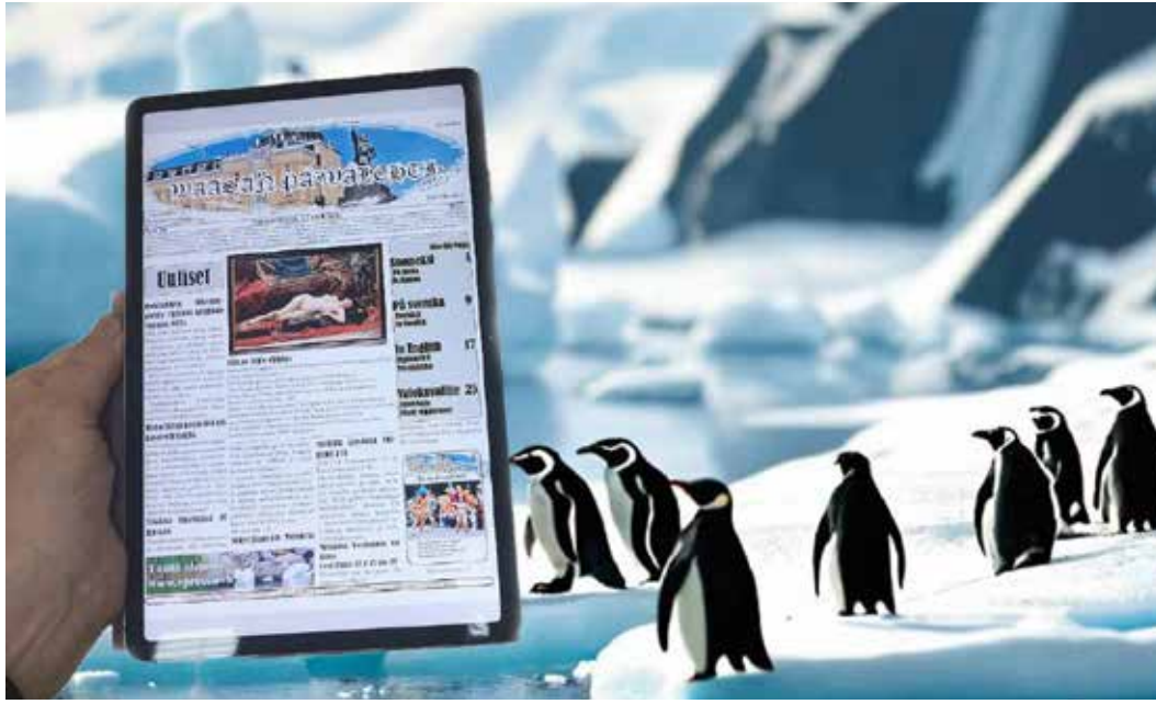
Kuten tässä, Antarktiksessa

joilla on tilanteen vaativuutta vastaava osaaminen ja kokemus.