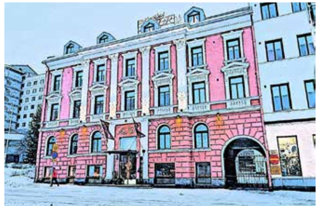
Viime viikon talo: Palosaaren kirjasto Övningsskolan