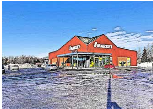
Viime viikon talo: Hotelli Astor