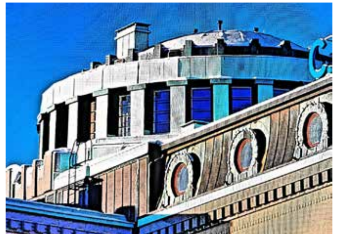
Viime viikon talo: Rewell Center