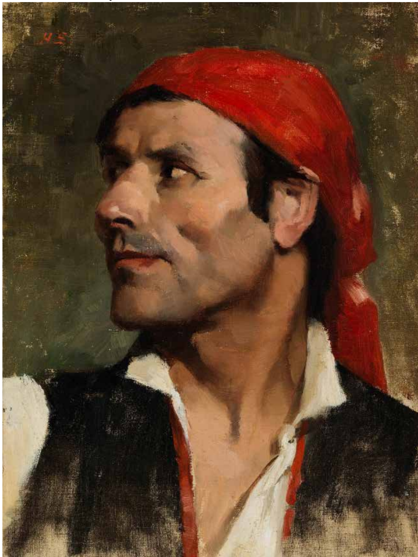
Helene Schjerfbeck 10.7.1862 - 23.1.1946 Espanjalainen, 1881