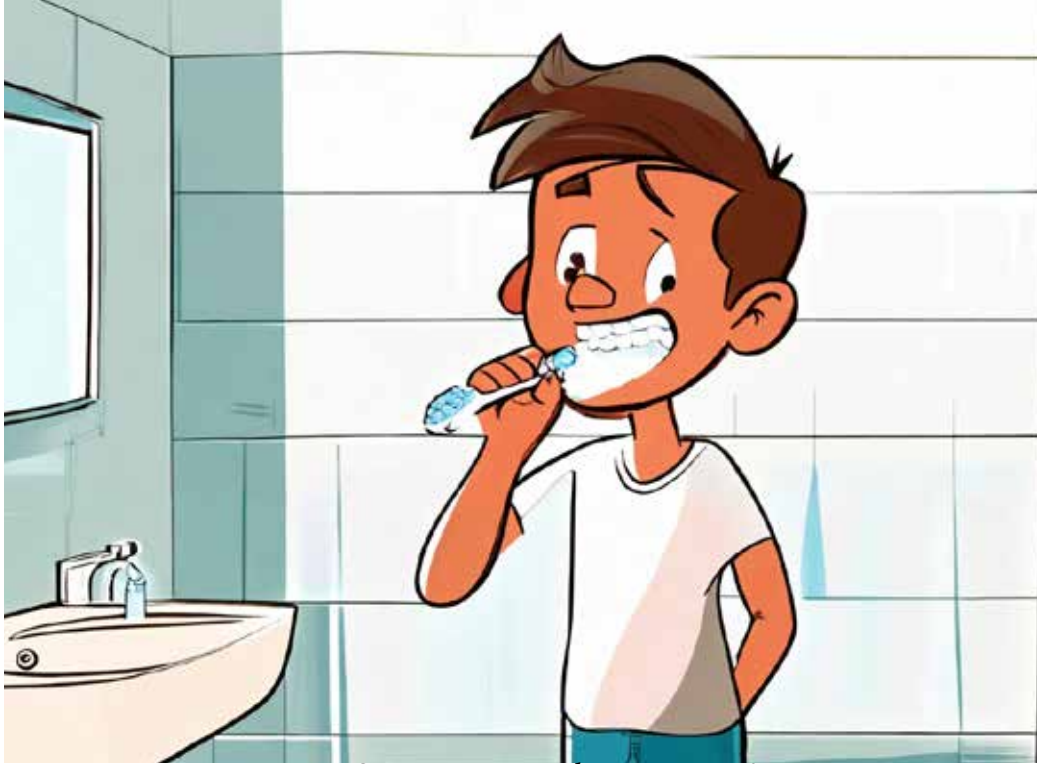
Suojaa aivoveritulppaa vastaan!

Uusi suomalaistutkimus on yhdistänyt parodontiitin, vakavan iensairauden muodon, nuorten aikuisten lisääntyneeseen aivohalvausriskiin. Tutkimukseksi, joka on julkaistu Journal of dental research -lehdessä, havaittiin, että 18–49-vuotiaat, joilla oli parodontiitti, kärsivät huomattavasti todennäköisemmin kryptogeenisestä iskeemisestä aivohalvauksesta (CIS), eräänlaisesta aivohalvauksesta, jonka syytä ei tunneta.