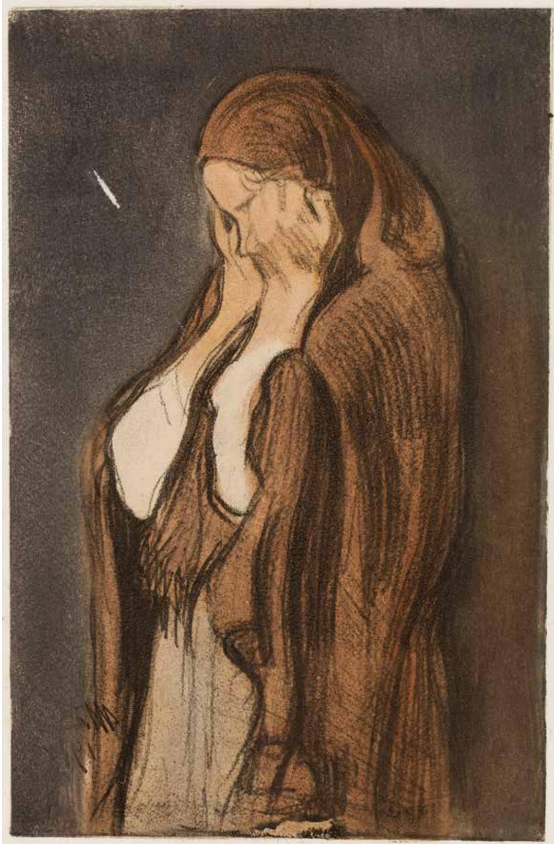
Magnus Enckell 9.11.1870, Hamina 27.11.1925, Tukholma Itkevä nainen, 1907