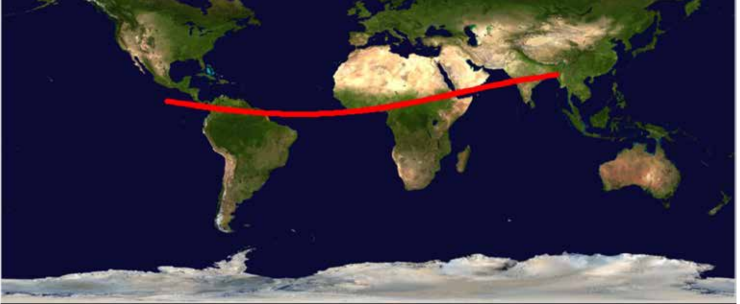
Törmäysriskikäytävä Near Earth -asteroidille 2024 YR4, mahdollinen törmäys 22. joulukuuta 2032.

Asteroidi nimeltä 2024 YR4, jonka halkaisija on 40–100 metriä (130–330 jalkaa), tekee tällä hetkellä aaltoja tiedeyhteisössä, koska se voi vaikuttaa maahan. ATLAS-järjestelmän (Asteroid Terrestrial-impact Last Alert System) 27. joulukuuta 2024 löytämä asteroidi on luokiteltu Apollo-tyyppiksi, mikä tarkoittaa, että se ylittää Maan kiertoradan. 29. tammikuuta 2025 alkaen YR4:lle on annettu Torinon asteikon luokitus 3, mikä osoittaa 1:77 (1,3 %) mahdollisuuden iskeä Maahan 22. joulukuuta 2032.