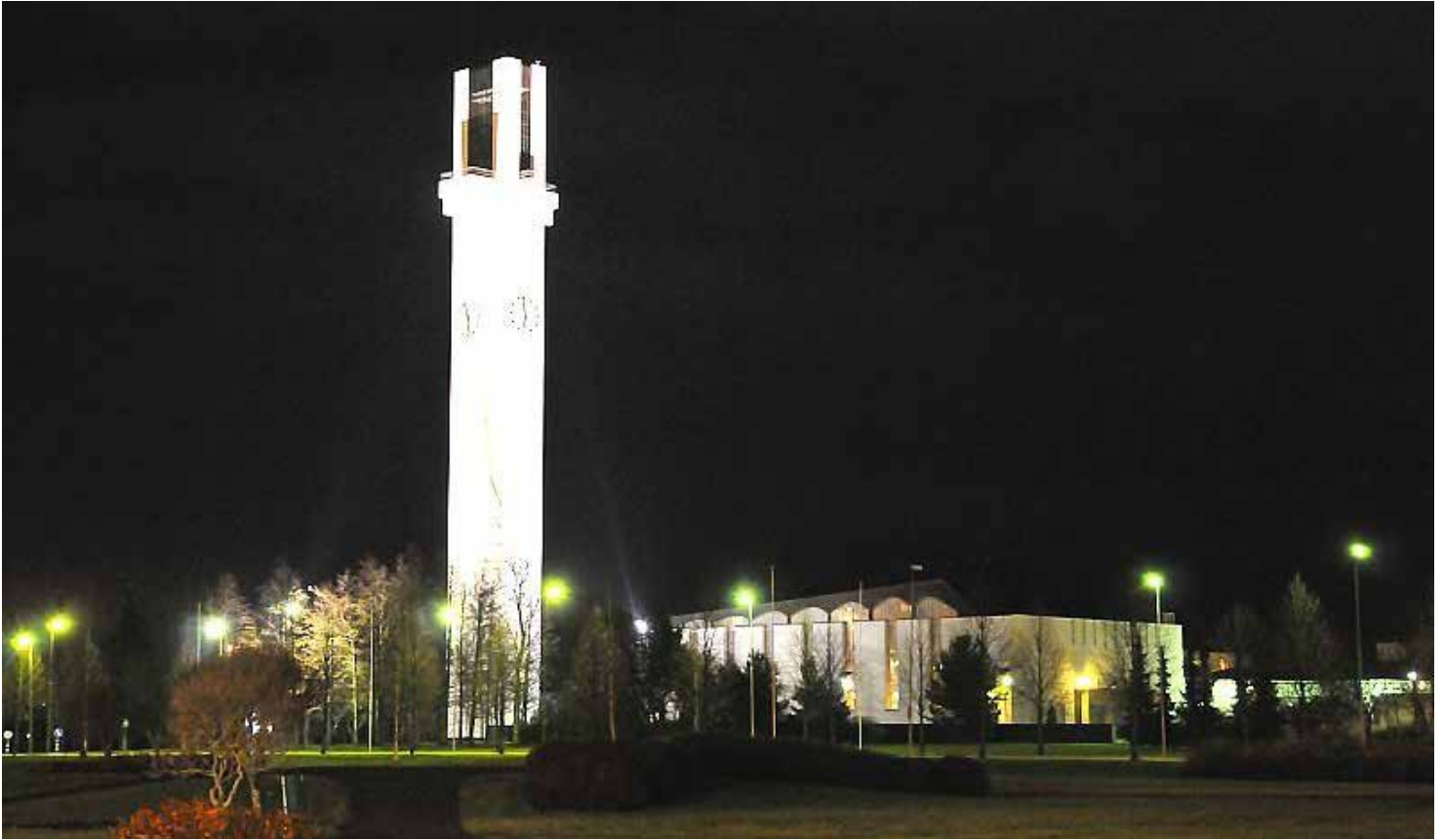
Seinäjoen Lakeuden Risti

Unescon maailmanperintöluetteloon saattaa pian tulla uusi suomalainen lisäys, kun Museoviraston valmistelema Aalto Works -esitys toimitetaan helmikuun 2025 alkuun mennessä Unescolle.