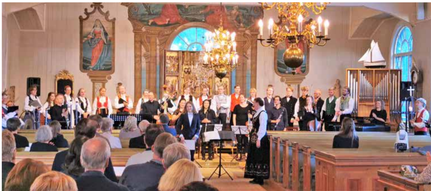
Korsholman musiikkijuhlien konsertti Vöyrin kirkossa vuonna 2022