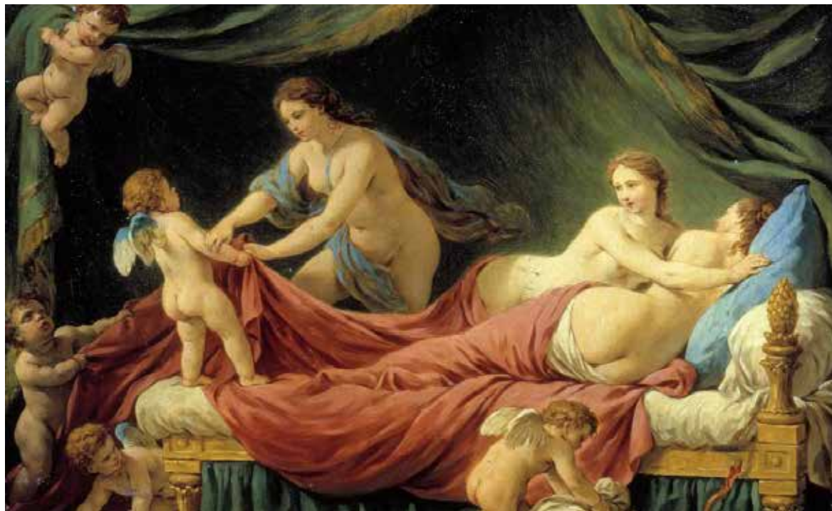
Jean Jacques Lagrenée nuorempi / den yngre / the Younger, 1739-1821 Kolme sulotarta, De tre gracerna , Three Graces , 1797