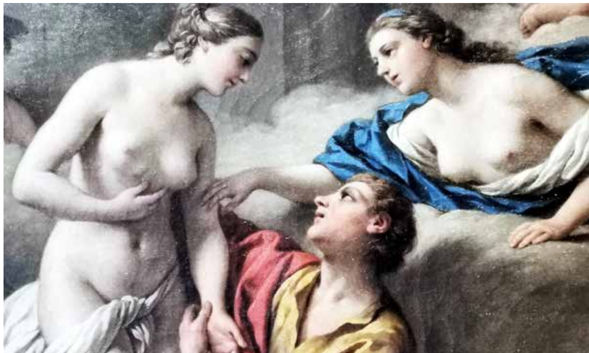
Louis Jean Francois Lagrenée 1725-1805 Pygmalion ja hänen veistoksensa Pygmalion and his statue