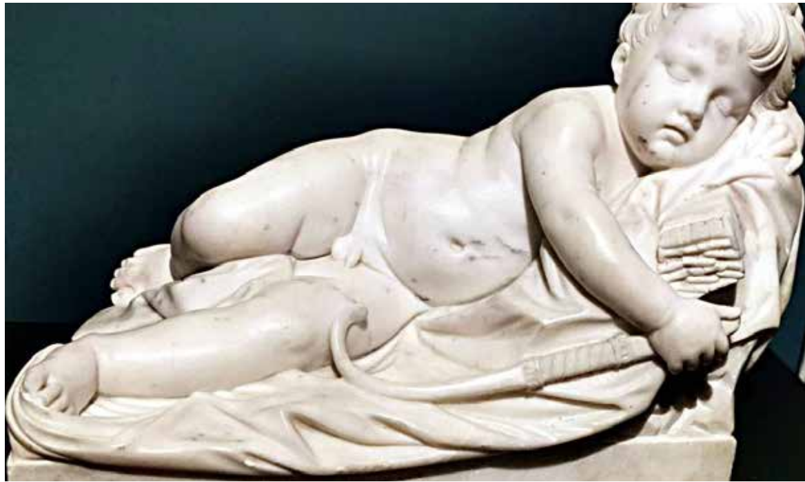
Bertel Thorvaldsen 19.11.1770 - 24.3.1844, Nukkuva Amor, Sovande Amor, Sleeping Amor, 1827