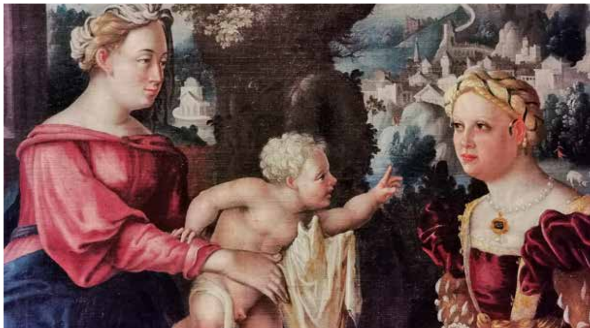
Tuntematon taiteilija, Okänd konstnär, Anomymous Neitsyt Marja, Jeesuslapsi ja lahjoittajat, 1553