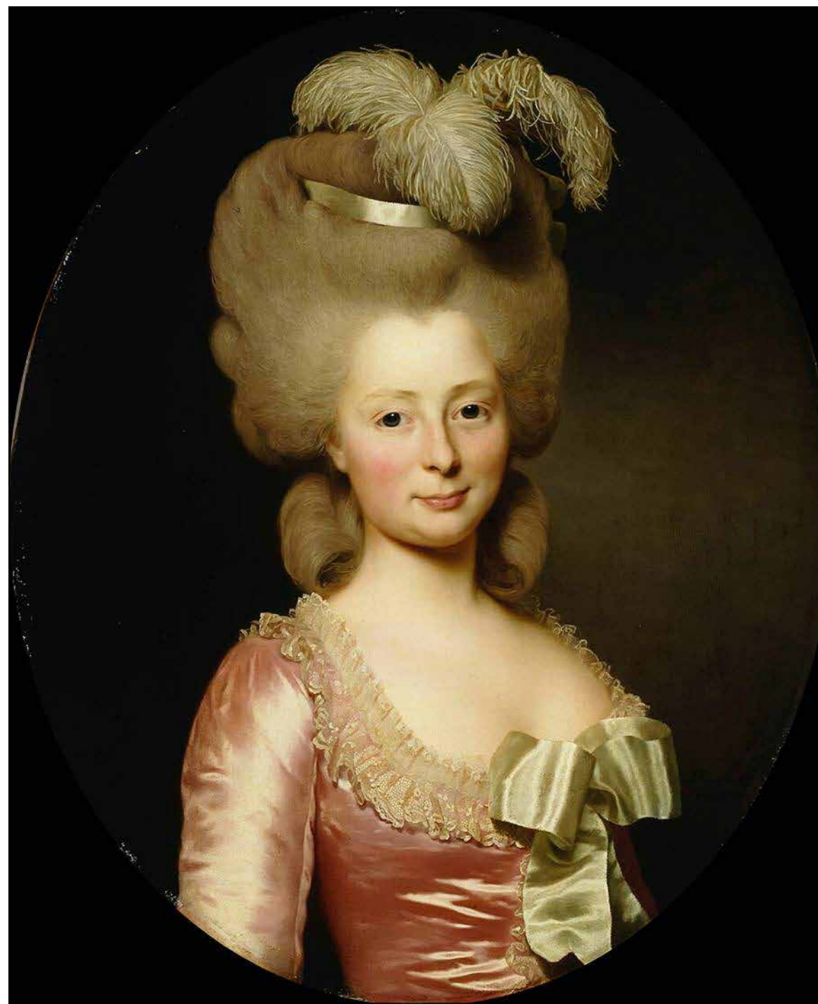
Alexander Roslin, Naisen muotokuva, Porträtt av en dam , Portrait of a Lady , 1780.