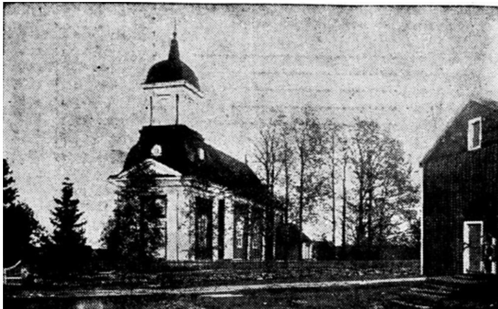
Pörtom kyrka, en bild publicerad i Vasabladet den 3.8.1940