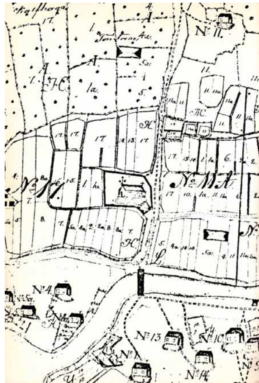
En karta från 1700-talet där den gamla kyrkan från 1650-talet finns inritad. Kartan finns publicerad i boken "Pörtom socken och kyrka under 200 år", 1983

Grundstenen till kyrkan lades den 21 september 1781 och prostens