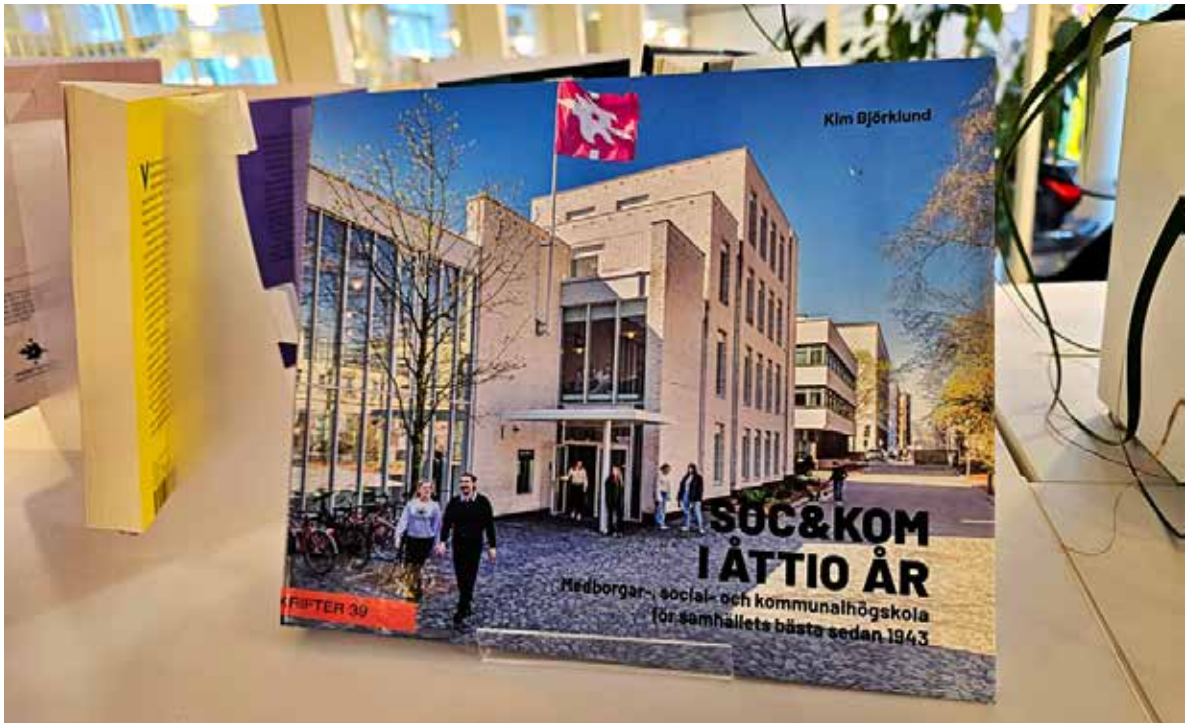
En minnesbok med anledning av högskolans 80-årsjubileum arkitekten Juha Leiviskä har ritat högskolans nuvarande byggnad i centrala Helsingfors